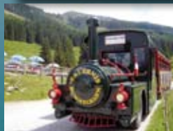
Erlebnis-Bummelbahn, Wildschönau siehe Seite 368