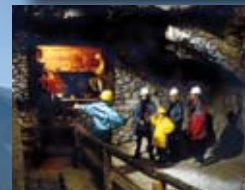
Silberbergwerk Schwaz siehe Seite 178