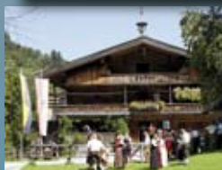
Bergbauernmuseum z´Bach siehe Seite 342