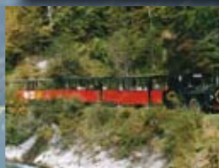
Bummelzug, Wildschönau siehe Seite 330