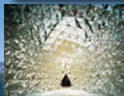
Swarovski Kristallwelten, Wattens, siehe Seite 360