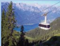
Rofan Seilbahn siehe Seite 76