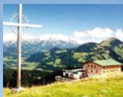
Rübezahlhütte, Niederau siehe Seite 336