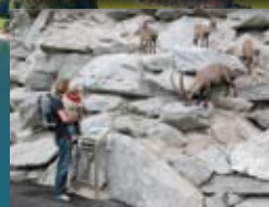
Alpenzoo, Innsbruck, siehe Seite 362