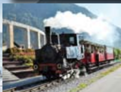
Achenseebahn siehe Seite 134