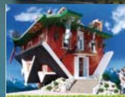
Haus steht Kopf, Terfens siehe Seite 192