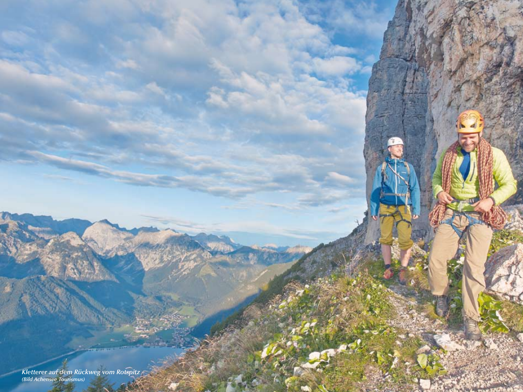
Kletterer auf dem Rückweg vom Rotspitz