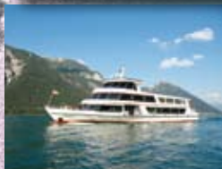
Achensee-Schiffahrt siehe Seite 40