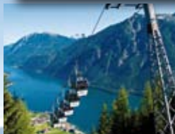
Karwendelbahn siehe Seite 96