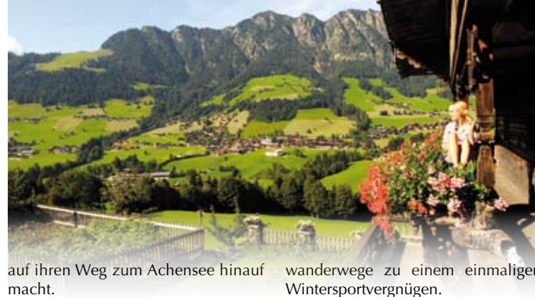
Blick auf Alpbach

auf ihren Weg zum Achensee hinauf macht.