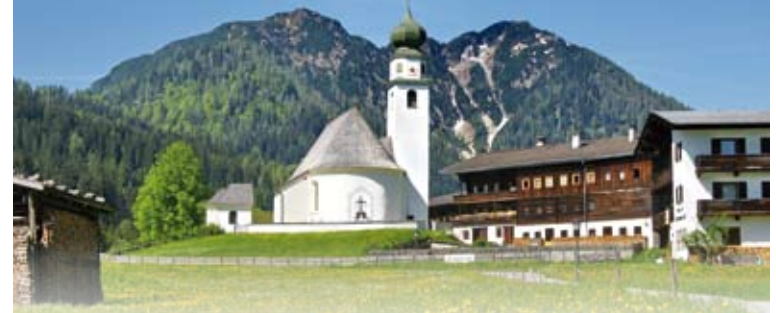
Thierbach in der Wildschönau

und Rodler kommen auf ihre Kosten, sind doch teilweise bis zu 20 Rodelbahnen angelegt, die sogar nachts bei Fackelschein besucht werden können. - schönste Wintersportfreuden in den kleinen Skigebieten, die abseits vom Massentourismus liegen. Hier werden auch kostenlose Skikurse für Kinder von 4-12 Jahren und Gäste 50+ angeboten. Winterwanderer finden ein dichtes Netz von geräumten Wegen und Skilangläufer bestens gepflegte Loipen im Tal und in der Höhe.