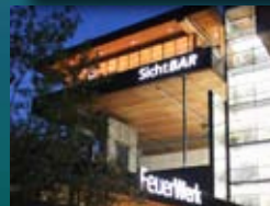
FeuerWerk/SichtBAR, Fügen siehe Seite 372