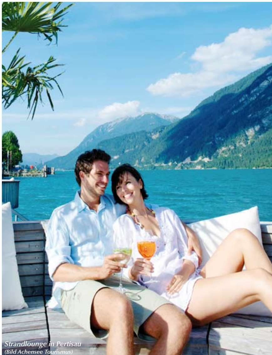
Strandlounge in Pertisau