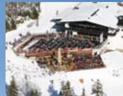
Hochalmlifte Christlums siehe Seite 54