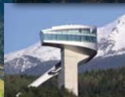
Bergisel Sprungschanze, siehe Seite 366