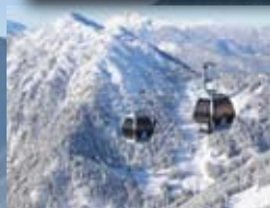
Schatzbergbahn, Auffach siehe Seite 332