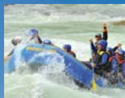
wasser-c-raft, Ötz siehe Seite 374