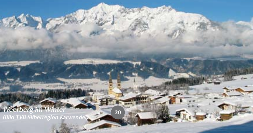
Weerberg im Winter

Während der Wintermonate präsentiert sich die Silberregion Karwendel als Eldorado für Wintersportler. Bergbahnen, die bis in Höhen von fast 2000 m transportieren, bringen Skifahrer und Snowboarder zu den besten Abfahrten für Familien und Genuss-Skiläufer. Doch auch Tourengeher