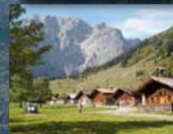
Eng Alm, Hinterriß siehe Seite 204