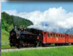
Zillertal-Dampfbahn siehe Seite 136