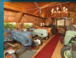
Achenseer Museumswelt siehe Seite 78