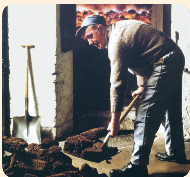
Ein Arbeiter bei der Befuerung der Pot Stills mit Torf bei Highland Park

Mälzen Diese Arbeit lassen heute fast alle Brennereien von externen Mälzereien erledigen. Mälzen heißt, dass die Gerstenkörner zum Keimen gebracht werden. Dabei entwickeln sie jene Enzyme, die Getreidestärke freisetzen und in Zucker umwandeln können. Zur Keimbildung muss die Gerste eingeweicht werden. Hat sie den optimalen Feuchtigkeits-