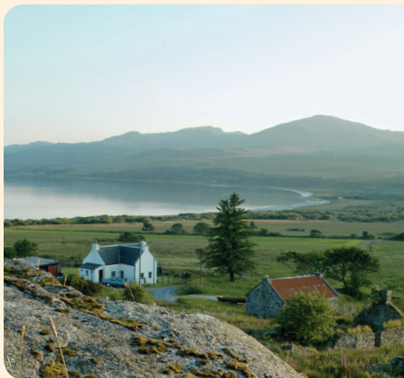
Unberührte Landschaft auf der Isle of Jura

Das zunehmend in Mode kommende Finishing hat den Markt der Single Malts bereichert wie nichts anderes zuvor. Unter diesem Begriff – auch wood finishing genannt – ist