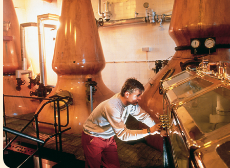
Ein Auchentoshan-Brennmeister bei der Kontrolle während der Destillation

Auchentoshan gibt es als Classic und Three Wood – ohne Jahrgang und in mehreren Altersstufen. Der Three Wood ist ein einzigartiger Whisky, der in drei verschiedenen Holzfä-