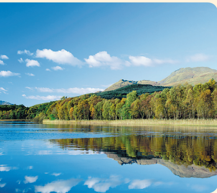
Schottland mit seinen Wäldern, Bergen und Seen, eine Landschaft wie aus dem Bilderbuch

Schätzungsweise 70 Prozent der Fässer in Schottland enthielten zuvor Bourbon- oder auch Tennessee Whiskey; die restlichen sind mehrheitlich Fässer, die zuvor Sherry enthielten, daneben sind aber auch solche in Gebrauch, in denen Portwein, Madeira, herkömmliche Weine oder auch eine Spirituose wie beispielsweise Rum lagerte.