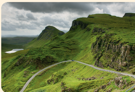
Wild und zerklüftet, aber immer grün sind die schottischen Berge

men. Inver House selbst wurde 2001 von der thailändischen International Beverage Holdings (InterBev) übernommen, agiert aber weitgehend unbeeinflusst als selbstständiges Unternehmen. Zur InterBev gehören zahlreiche Blended-Scotch-Marken und neben Balblair noch die Brennereien Knockdhu, Speyburn, Old Pulteney und Balmenach. Von Balblair wurden bis 1998 nur einige Single Malts durch die »Unabhängigen Abfüller« angeboten, seit 1998 gibt es Balblair auch als Eigentümerabfüllungen. Die Single Malts von Balblair gelten als leicht und trocken und stehen in einem guten Preis-Leistungs-Verhältnis. Balblair bietet mit seiner neuen Reihe die ganze Vielfalt der Northern