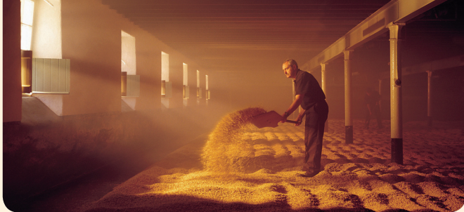
Arbeiter in der Mälzerei bei Balvenie in Dufftown

Um aus einem leicht alkoholischen Getränk, wie in diesem Fall »Bier«, ein hochprozentiges (hier: Whisky) zu gewinnen, muss der Brenner den zuerst aufsteigenden Alkoholdampf auffangen und durch Kühlen wieder verflüssigen. Scotch Malt Whisky wird üblicherweise zweifach in der traditionellen Brennblase ( pot still ) destilliert. Die Brennereien in den Lowlands brannten früher meistens dreifach; heute aber wird das triple distilling nur noch von der in den Lowlands gelegenen Auchentoshan Distillery praktiziert. Bei der ersten Destillation in der wash still wird der Alkoholgehalt des »Biers« auf etwa 21 % erhöht. Durch Zugeben von Vorlauf und Nachlauf aus der vorangegangenen Destillation wird dieser im ersten Durchlauf erzeugte Rohbrand ( low wines ) auf etwa 28 % Alkoholgehalt verstärkt. Die zweite Destillation, die in der sogenannten spirit- oder low wines still abläuft, dient der weiteren Konzentration und der Reinigung des Destillates. In dieser Phase werden Vorlauf und Nachlauf vom Mittellauf abgetrennt und beim nächsten Destillieren zum Rohbrand gegeben. Nur der saubere, von nicht erwünschten Bestandtei-