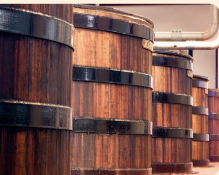
Großbehälter für die wash in der Bowmore Distillery auf Islay

In der Regel trägt ein Single Malt den Namen seiner Brennerei als Markennamen. Es gibt allerdings auch ein paar Destillerien, die zwei verschiedene Malts herstellen und einem der beiden einen anderen Namen geben. Hinzu kommt der eine oder andere Phantasiename, den unabhängige Abfüller ihrem jung von der Brennerei gekauften, selbst gelagerten und abgefüllten Malt geben, oder der Name eines Malts, der z. B. exklusiv für eine Handelskette abgefüllt wurde. Auf diese Weise kommen vielleicht 200 Marken zusammen, von denen aber allenfalls um die 120 wirklich von Bedeutung sind. Die Zahl der Abfüllungen hingegen ist Legion – damit sind die einzelnen Alters- und Qualitätsstufen der verschiedenen Marken gemeint. Die »einfachsten« der möglichen Varianten sind noch die Altersstufen : 12, 15, 18, 21, 25 years old oder mehr – auf jeden Fall richtet sich eine Altersangabe immer nach dem jüngsten im betreffenden Malt enthaltenen Einzelwhisky. Ein als 12 years old etikettierter Single Malt wird also im Durchschnitt um einige, vielleicht sogar um viele Jahre älter sein. Wenn ein Whisky oder auch ein Whiskey erst einmal in die