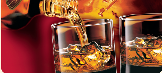
Johnnie Walker Red Label, die führende Blended Scotch Marke