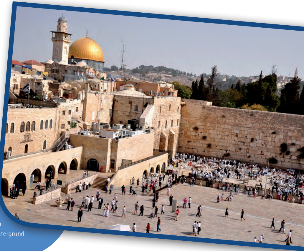
Die Westmauer in Jerusalem mit dem Felsendom im Hintergrund

Ein beliebtes Pilgerziel ist das Grab Davids. David schuf das Gesamtreich aus Juda und Israel (um 1010-970 v. Chr.) und machte Jerusalem zu seiner Hauptstadt.