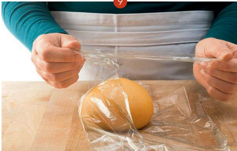
9. Den Nudelteig zur Kugel rollen, in Frischhaltefolie einschlagen und bis zur weiteren Verarbeitung bei Raumtemperatur 1 Stunde oder im Kühlschrank für längere Zeit ruhen lassen.

½ TL Salz, 125 g Weizenmehl Type 405, 2 Eiern und 1 Eigelb einen glatten Teig herstellen und ruhen lassen (siehe Abb. 1 bis 9). Das Kneten dauert hier etwa doppelt so lange wie bei den anderen beiden Teigen. Die Mischung aus Hartweizengrieß und Weizenmehl (Type 405 oder 550) ergibt besonders kernige Nudeln. Italienischer Hartweizengrieß (»semola di grano duro«) ist in der Regel feiner als deutscher.