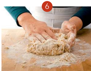
5. Nun mit den Händen das Mehl von außen über die Eier-Mehl-Mischung verteilen. 6. Alle Zutaten gut miteinander verkneten. Falls nötig, 1 bis 2 TL Wasser einarbeiten.