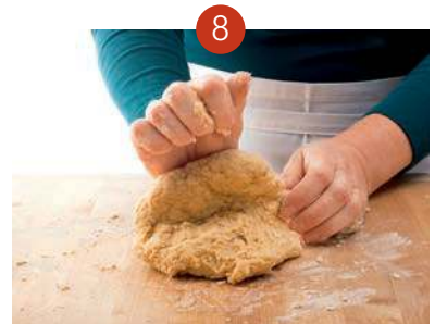
7. Den Teig mit den Handballen auseinanderdrücken und (8.) wieder zusammenlegen. Auf diese Weise den Teig etwa 10 Minuten kneten, bis er glatt und geschmeidig ist.