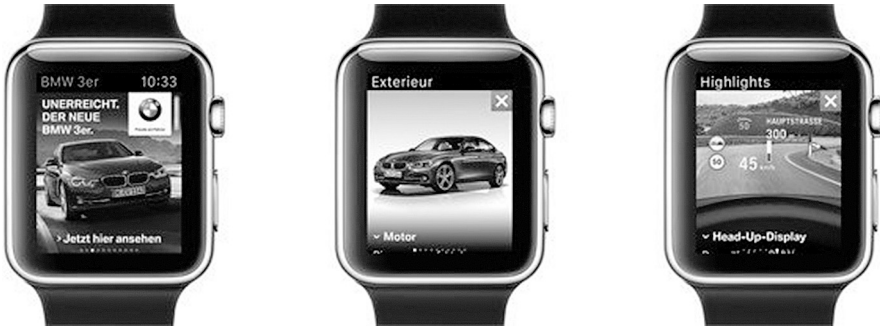
Abb. 1: Digital Marketing: Miniaturisierung/Apple Watch

durch die Miniaturisierung im Hardwarebereich, ist eine notwendige Bedingung für die Entwicklung elektronischer Geschäftsmöglichkeiten. Diese Rechnerleistung ist letztendlich dafür verantwortlich, dass der Anwender über ein Zugriffsmedium die zahlreichen heterogenen Informationen (z. B. Produkt- und Zahlungsinformationen, Kommunikation mit dem Handelspartner), die für eine Transaktion notwendig sind, überhaupt erfassen und kontrollieren kann. Die Schnelligkeit der Informationsverarbeitung der elektronischen Medien basiert dabei gerade auf der technischen Form der Inhalte, der digitalen 0/1-Informationen.