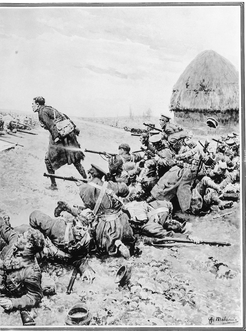
Schützen auf und mähten die Briten nieder. Typisch sei das für die »Hinterhältigkeit des Feindes«. Wütend beschimpft ein englischer Offizier die so heimtückischen Gegner.