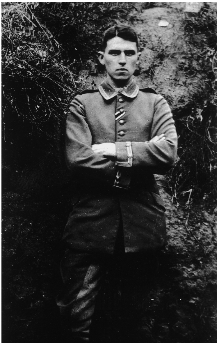
Carl Zuckmayer meldete sich 1914 als Achtzehnjähriger direkt nach dem Abitur freiwillig an die Front. Er überlebte den Krieg, doch bevor der nächste begann, ging er in die Emigration.