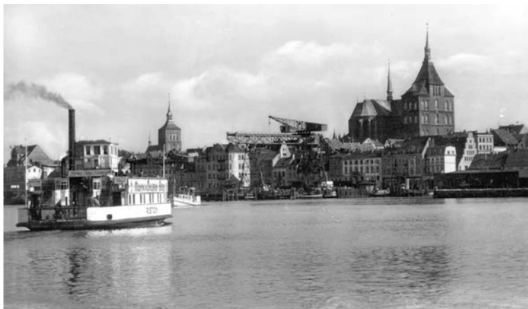
Rostock um 1935

Kempowski war geleitet durch das Vorbild der Eltern und die Auseinandersetzung mit ihnen. Auch die schulische Sozialisation, die Anregungen der Lehrer beeinflussten ihn. Früh bildeten sich Bezugspunkte heraus, die in kulturellen und politischen Fragen sein späteres Leben bestimmten, vor allem sein Verhältnis zur Literatur und Pädagogik sowie seinen Umgang mit Geschichte.