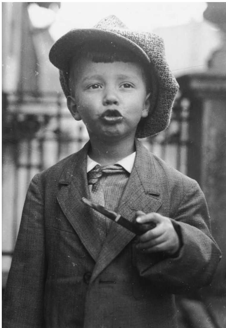
Alexandrinenstraße 81, 1934