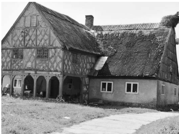
Vorlaubenhaus auf der Elbinger Höhe

Kempowski, der unter der Aufsicht des Pastors stand, unterrichtete die Kinder in seinem Vorlaubenhaus, im Sommer 15 Stunden pro Woche, im Winter 30. Er bekam nur noch 18 Taler Gehalt, kaum mehr als ein Knecht verdiente. Die Verschlechterung spricht für einen unrühmlichen Abgang von seiner ersten Stelle.