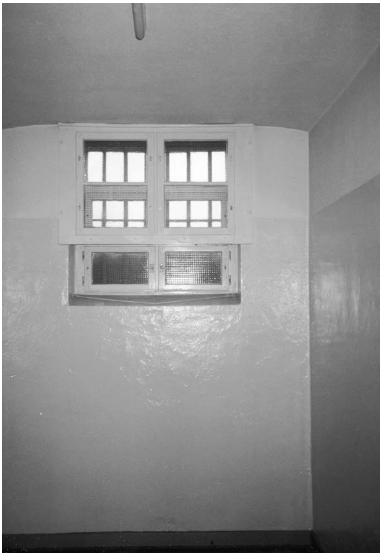
Schwerin, Gefängnis am Demmlerplatz, Zelle 54