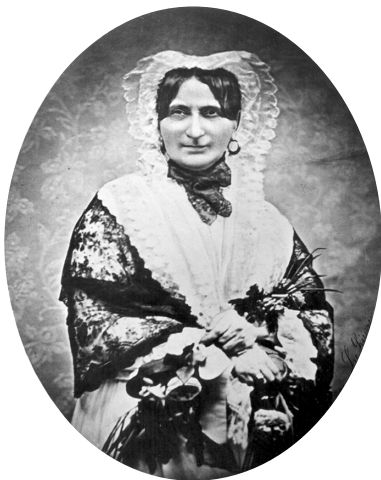
Carolyne von Sayn-Wittgenstein (Aufnahme 1876) und Franz Liszt waren seit 1847 ein Paar »... indem sie die schwersten Pflanzercigarren dabei rauchte und einen fürchterlichen Qualm verursachte« (Hans von Bülow über Carolyne von Sayn-Wittgenstein).

treffliche Dame«, wie sie Franz schrieb, gleichwohl redete sie ihm ins Gewissen, er möge sich nicht zu sehr mit den »hohen Damen« einlassen – »du hast ja Lehrgeld gegeben«. 45 Doch jener mütterliche Ratsschlag samt Erinnerung an Marie d'Agoult (»Lehrgeld«) kam zu spät, denn Franz und Carolyne hatten längst beschlossen, die Zukunft gemeinsam zu gestalten.