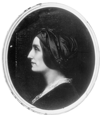
Cosimas Mutter: Marie d'Agoult (Gemälde von Henri Lehmann, 1839), die als Schriftstellerin unter dem Pseudonym Daniel Stern anerkannte histo- rische Werke verfasste.