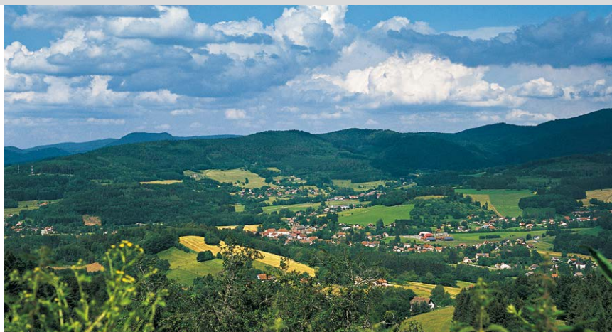
On a un vaste panorama sur la cuvette de la vallée de Ban-de-Laveline.

Cette belle maison se trouve à Ban-de-Laveline.