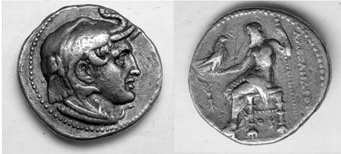
Abb. 1: Prägung Ptolemaios' I.; Vorderseite: Alexander der Große mit Elefantenexuvie; Rückseite: Zeus

die als Chlamys, also Reitermantel getragene Ägis des Zeus hinzutreten konnten. 20 Hiermit hatte Ptolemaios eine neue symbolische Agenda geschaffen, mittels der er sich deutlich von den übrigen Diadochen absetzen konnte, denn die Elefantenexuvie war ein von ihm eigens geschaffenes Attribut für den Gott Alexander, dessen wichtigster Kultort gleichzeitig Alexandria an der ägyptischen Küste war. Der Skalp des Elefanten spielte schließlich auf den Sieg des Alexander in seiner letzten großen Schlacht gegen König Poros und dessen Elefanten in Indien an: Damit hatte das Alexanderreich seine größte Ausdehnung erhalten. So symbolisierte die Kopfbedeckung des neuen Gottes den gesamten von ihm eroberten Raum, von Siwa bis nach Indien, und ihr Schöpfer Ptolemaios konnte sich als legitimer Nachfolger Alexanders präsentieren.