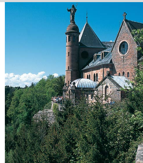
Couvent du Mont Ste-Odile.

Près de la Grotte des Druides (11) , des toits rocheux enjambent deux tombes préhistoriques (dolmens). 200 m plus loin, continuez à droite par le chemin balisé d'un point rouge . Le chemin de forêt plat et sableux tombe au bout d'autres 200 m sur le rectangle rouge (GR5) sur lequel vous vous orientez. À l'endroit où il croise l'itinéraire balisé d'un point bleu , vous passez devant la Roche du Panorama, la Porte Eyer ainsi que devant le Rocher à Bassins en grès bigarré d'environ 4 m de haut avec une petite grotte. Le chemin de croix et le rectangle rouge-blanc-rouge vous ramènent au couvent sur le Mont Ste-Odile (1) .