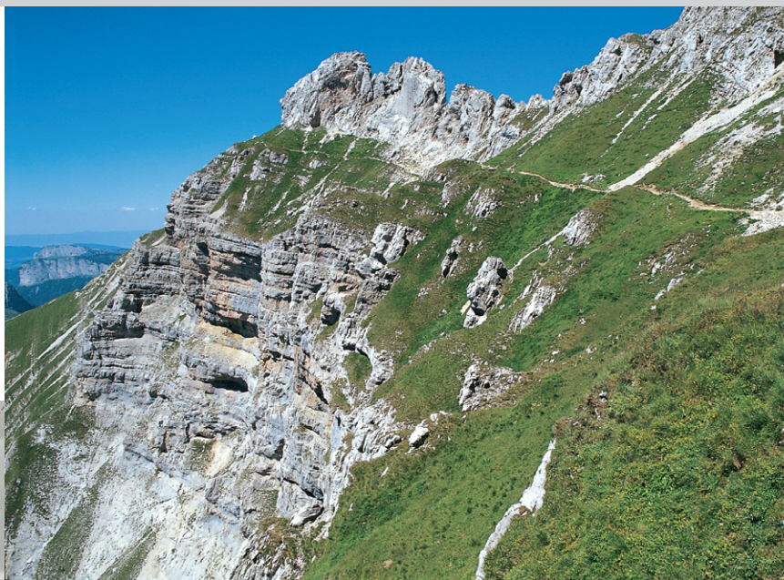
Le chemin d'altitude juste avant le sommet de la Tournette.

Pointe de la Bajulaz (2254 m) ; quelques minutes plus tard, vous voyez pour la première fois le sommet de la Tournette. Gagnez par un chemin panoramique digne d'une carte postale le « Fauteuil » de la Tournette, que vous gravisiez après un simple passage d'escalade. De là, vous pouvez contempler l'intégralité du lac 1900 m plus bas ainsi que bon nombre de cimes.