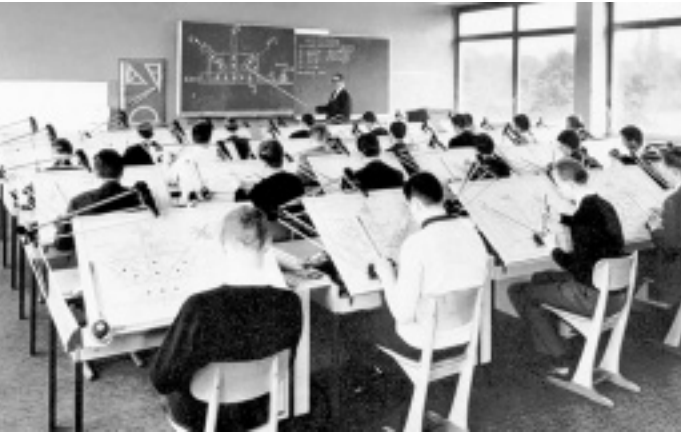
Arbeit am Zeichenpult: Unterricht im Hör- und Zeichensaal Anfang der 60er Jahre, Wilhelm-Bertelsmann-Straße.

1959 unterzeichneten Kultusministerium und Stadt den Vertrag über die Errichtung der Ingenieurschule auf dem Gelände der früheren Stadtgärtnerei an der Wiesenstraße. Im Juli 1960 wurden die ersten 63 Absolventen feierlich in der Aula der Kuhlo-Realschule verabschiedet. Sie fanden schnell eine Anstellung, zum größten Teil in der Industrie des Bielefelder Raumes. Als der dritte und letzte Bauabschnitt 1965 beendet war und der 14-Millionen-Mark-Bau eingeweiht wurde, waren schon 600 Absolventen aus dem Provisorium Ingenieurschule hervorgegangen.