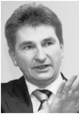
„Attraktives Umfeld“: NRW-Minister Andreas Pinkwart.

„Mit ihrem Fachbereich Ingenieurwissenschaften und Mathematik bietet die Fachhochschule Bielefeld hochwertige Ausbildung in einem Bereich, der für die Zukunft eines modernen Industriestandorts besonders wichtig ist. Und die Perspektiven sind gut. In der besonders jungen Region wird die Nachfrage nach Studienplätzen hoch bleiben. Bielefeld darf also damit rechnen, dass starke Ingenieurwissenschaften an der FH auch künftig ein attraktives Umfeld für Unternehmen sichern.