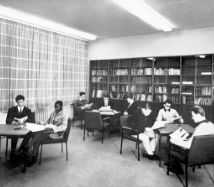
Blick ins Buch unter Neonlicht: Der Leseraum der studentischen Selbstverwaltung Anfang der 60er Jahre.

Fachbereich Maschinenbau mit den Studienrichtungen Konstruktionstechnik, Fertigungstechnik mit den Studienschwerpunkten Metallverarbeitung und Kunststoffverarbeitung. 1994 kam der Fachbereich Mathematik und Technik hinzu.