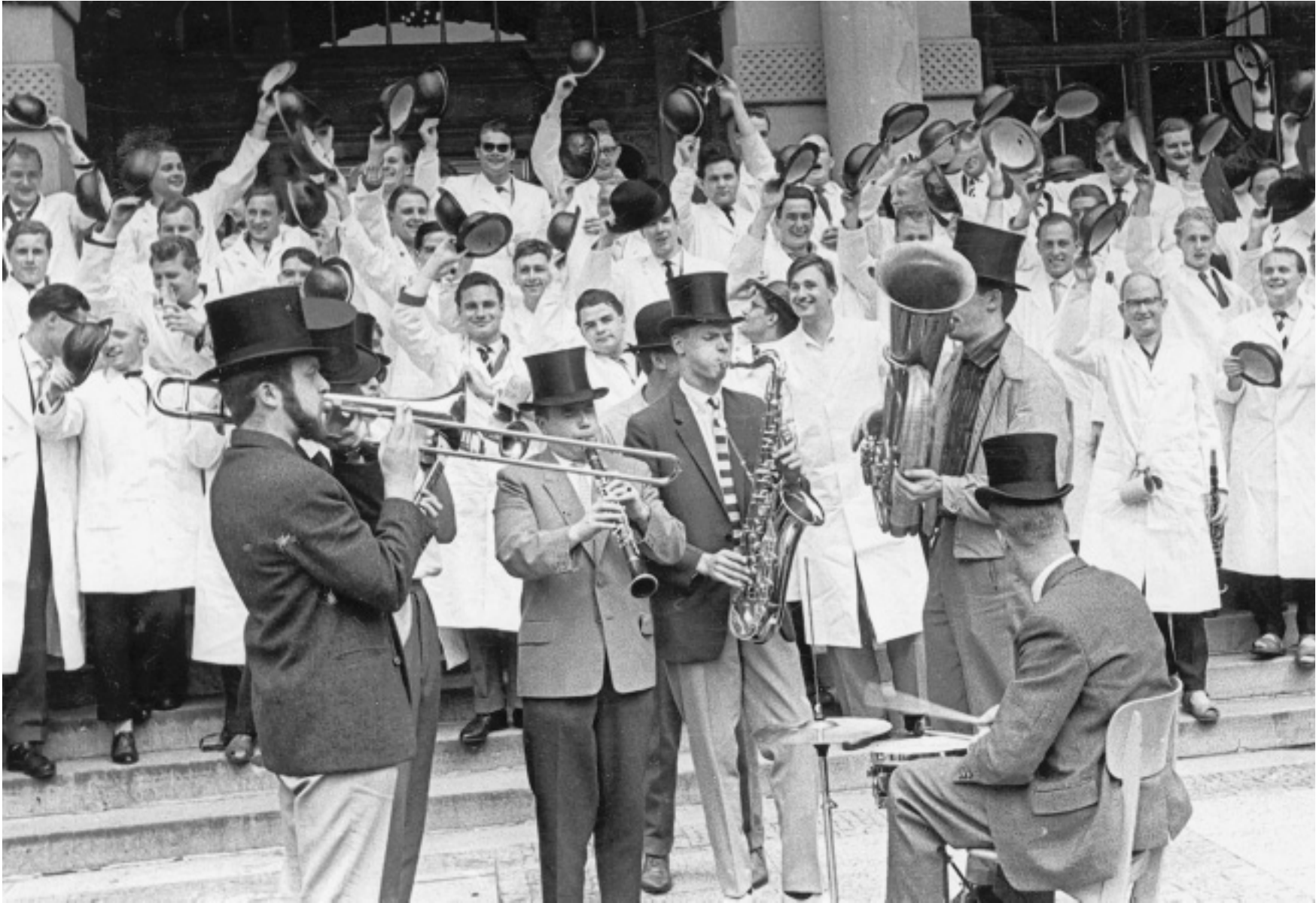
Mit Musik vor dem Rathaus: Im Juli 1960 feiert der erste Jahrgang der Ingenieurschule Bielefeld ausgelassen seinen Abschluss auf den Rathaustrappen. Man trägt Kittel, Hut und sogar Sonnenbrille.