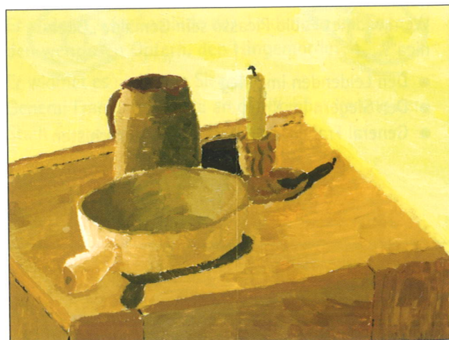
Marc Hausen, 9. Schuljahr: Küchenstillleben (Bleistift und Wasserfarben)

Die Schülerinnen und Schüler arbeiten mit eingeschränkter Palette.