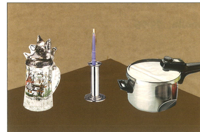
Henning Slotta, 7. Schuljahr: Küchenstillleben (Collagen)