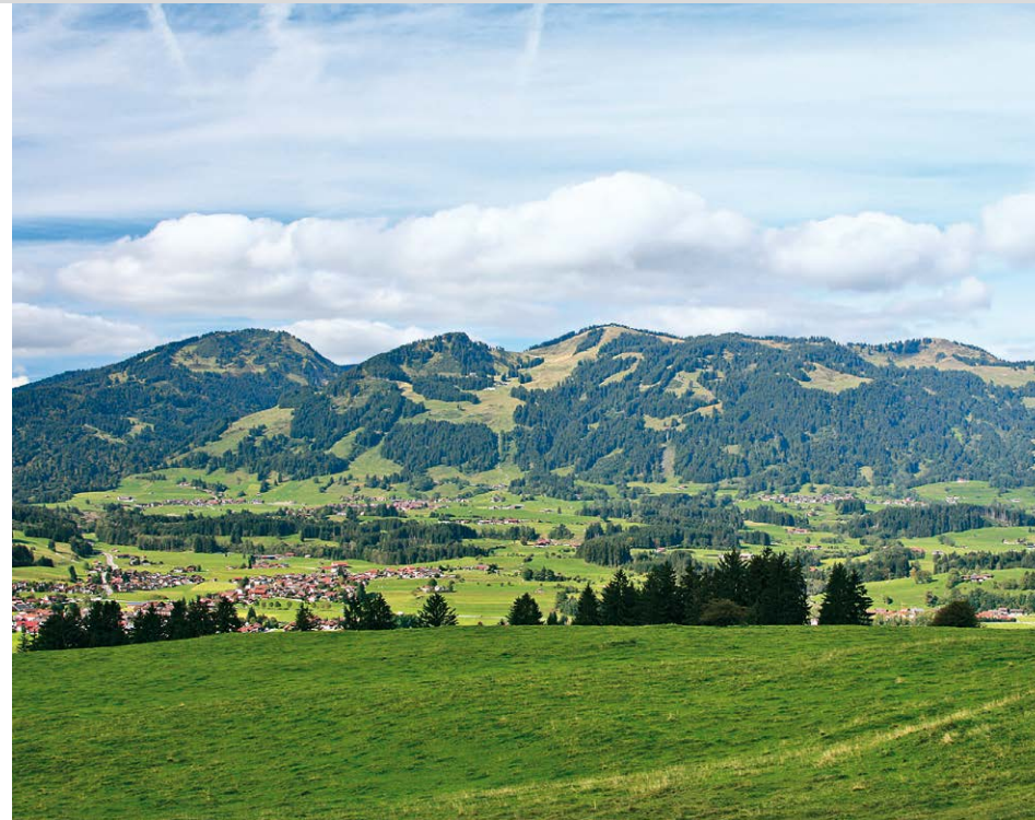
Die Hörnerkette mit den Wiesenkuppen von Rangiswanger Horn und Weiherkopf.