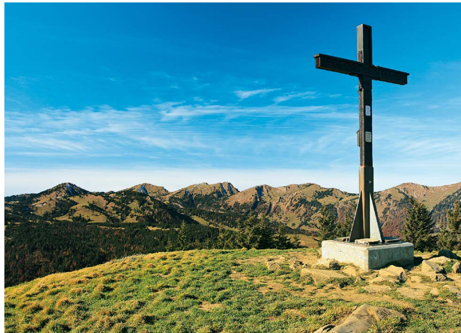
Gipfel des Rangiswanger Horns; im Hintergrund die Nagelfluhkette.

Gipfel über seine Südflanke ist gemächlicher als der Anstieg, und nach wenigen Minuten treffen wir wieder auf den Hauptweg (1563 m), auf dem man den Gipfel des Rangiswanger Horns links hätte umgehen können. Hinter einem kleinen Waldstück öffnet sich der Blick erneut, und vor uns breitet sich ein wunderschönes Hochmoor aus, gespickt mit ein paar pittoresken Fichten mit den Gipfeln der Allgäuer Alpen im Hintergrund. Hinter dem Moor folgt noch ein letzter, recht steiler Anstieg hinauf zum Weiherkopf (6) , 1665 m, dem höchsten Punkt auf unserer Tour und dem letzten Gipfel, der seinen Vorgängern in puncto Aussicht in nichts nachsteht. Die letzte kurze Etappe besteht aus einem sehr steilen Abstieg hinunter zur Bergstation der Hörnerbahn (7) , 1540 m. Von hier schweben wir zur Talstation in Bolsterlang (8) .