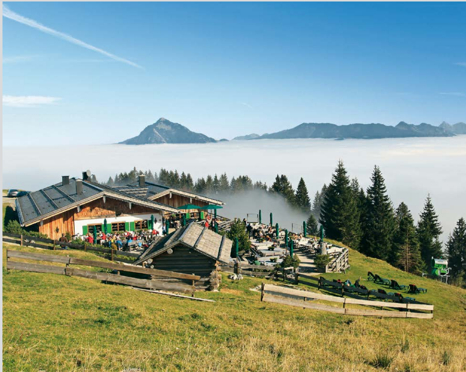
Die Weltcuphütte beim Ofterschwanger Horn.

Gemütlich geht es von der Sessellift-Talstation (1) in Ofterschwang , 880 m hinauf zur Bergstation Weltcupexpress (2) , 1294 m, wo wir uns nach links wenden und dem breiten Fahrweg folgen, der gemächlich durch offene Weideflächen Richtung Ofterschwanger Horn ansteigt. Nach gut 15 Min. ist rechts oberhalb das Gipfelkreuz zu erkennen, zu dem wir auf einem Trampelpfad über eine steile Wiese hinaufsteigen.