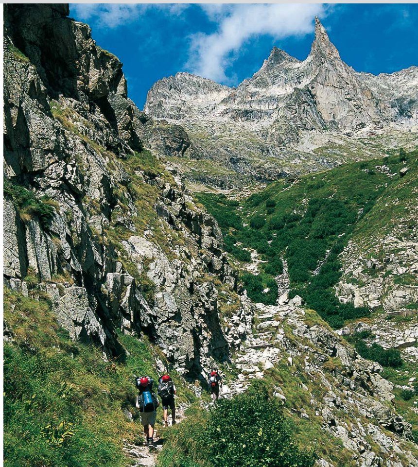
Aufstieg zum Refuge de Soreiller, im Hintergrund die Aiguille Dibona.

Abstieg entweder auf demselben Weg oder entlang des Ruisseau d'en Bas, dieser Weg ist allerdings deutlich anspruchsvoller (steiler und exponierter) als die Aufstiegs-