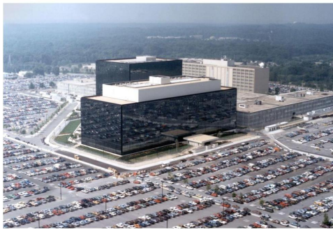
Abb. 18: Wissensasymmetrie