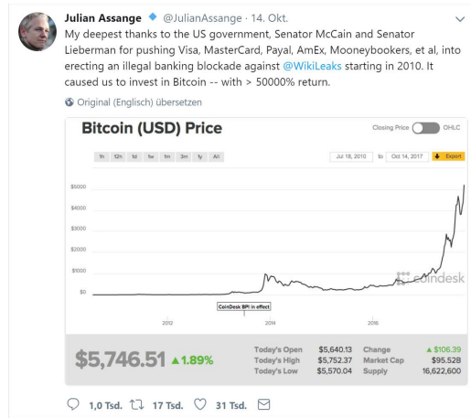
Abb. 22: Tweet von Julian Assange vom 14.10.2017

Amerikanischen Kreditkartenfirmen wurde 2010 verboten, Zahlungen für WikiLeaks anzunehmen. Julian Assange bedankte sich dafür in einem Tweet: