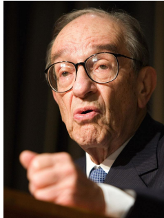
Abb. 23: Alan Greenspan

“Wir haben das Glück, dass die politischen Beschlüsse in den USA dank der Globalisierung größtenteils durch die weltweite Marktwirtschaft ersetzt wurden. Mit Ausnahme der nationalen Sicherheit spielt es kaum eine Rolle, wer der nächste Präsident wird. Die Welt wird durch Marktkräfte regiert.”