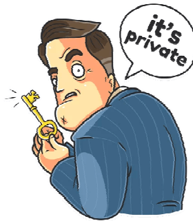
Abb. 19: It's private

Bei Geld mit Privatsphäre wissen nur die Beteiligten vom Eigentumsübergang. Bei einer Banküberweisung wissen es viele – mehr als Ihnen lieb ist. Das Schlimmste daran ist, dass Sie gar nicht wissen, wer es alles weiß.