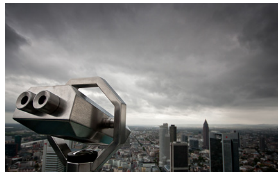
Gewinnerbilder der Foto-Challenge in Frankfurt mit den Themen Kreativ (l), Menschen (m) und Stadt/Landschaft (r)

ten wir genug Filmmaterial gesammelt, um ein interessantes Video zusammenzuschneiden. Gerade noch rechtzeitig zum Abgabetermin hatte ich alles komplett und schickte es weg. Nun galt es abzuwarten. Laut Internetseite hatten sich mit mir über tausend Fotografen auf diesen außergewöhnlichen Job als fotografierender World Scout beworben. Diese Bewerbungen mussten von SIGMA akribisch ausgewertet werden, denn es konnte letztendlich ja nur einen World Scout geben. Tage und Wochen vergingen, dann endlich der ersehnte Anruf: Ich war in der engeren Auswahl und sollte mit neun Mitbewerbern mein Können bei einer Foto-Challenge in Frankfurt unter Beweis stellen!