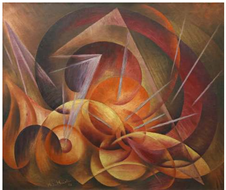
14 HANS SIEBERT VON HEISTER Der Gipfel, 1922

Kunstaussstellung Berlin 1920, Abt. der Novembergruppe, Nr. 1491, mit Abb. im Katalog