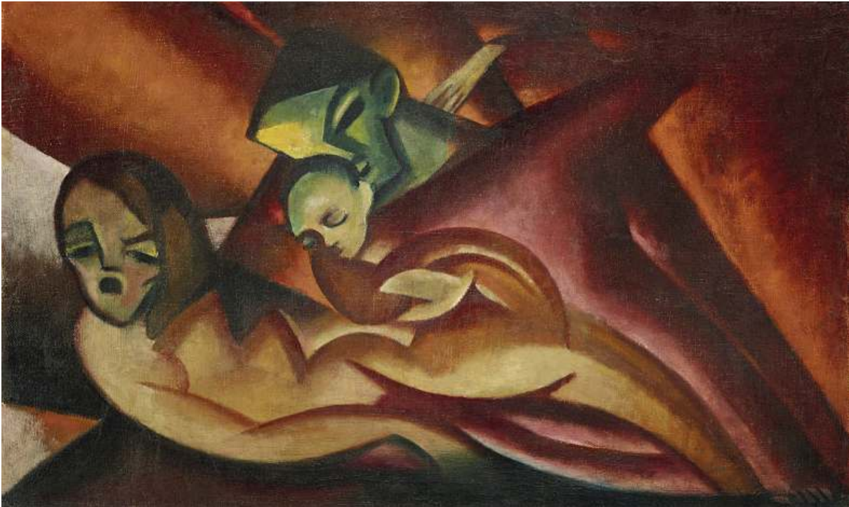
13 KARL VÖLKER Geburt, 1919

Öl auf Leinwand, 77,5 × 129,5 cm Kulturstiftung Sachsen-Anhalt, Kunstmuseum Moritzburg Halle (Saale)