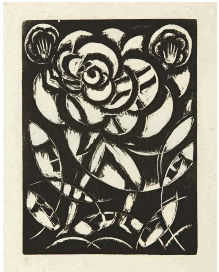
Abb. in Der Kunsttopf , 1920, Heft 6, S. 103

Holzschnitt, 16,8 × 13,9 cm Berlinische Galerie