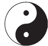
Abb. 1.7: Yin und Yang