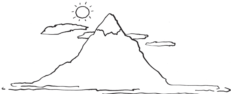
Abb. 1.4: Urbild von Yin und Yang

Das Urbild von Yin und Yang ist das eines Berges mit einer sonnenbeschienenen und einer Schattenseite. Die Sonnenseite wird Yang genannt. Dort ist es wärmer und heller. Die Pflanzen streben dem Licht entgegen und öffnen ihre Blüten, Wasser verdampft und steigt nach oben. Der Schatten entspricht dem Yin , es ist kühler und dunkler. Die Pflanzen schließen ihre Blüten, Wasserdampf kondensiert zu Wasser und tropft nach unten, um von der Erde aufgenommen zu werden.