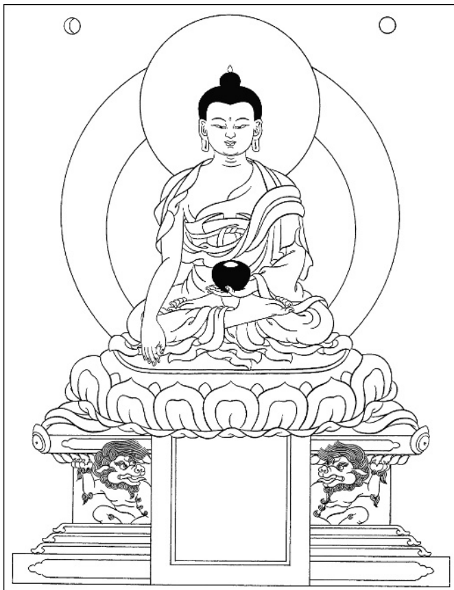
Abbildung 1.1: Shakyamuni Buddha

Schließlich erreichte Prinz Siddhartha im Alter von 35 Jahren sein Ziel. Als er unter einem Baum saß, der später als der Bodhi-Baum – der Baum der Erleuchtung – bekannt wurde, erlangte er das vollkommene Erwachen der Buddhaschaft. Von diesem Zeitpunkt an wurde er Shakyamuni Buddha genannt, der vollkommen erwachte Weise ( Muni ) aus dem Shakya-Geschlecht (siehe Abbildung 1.1).