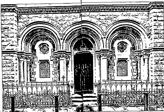
Fassade der St Teresa's Church (siehe S. 36)