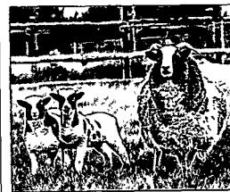
Schafe einer Farm bei Newbridge Demesse, nördlich von Dublin

NAHVERKEHRSNETZ Hintere Umschlaginnensetten