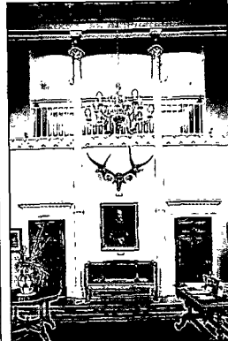
Avondale House (siehe S. 109), Heim von Charles Stewart Parnell