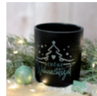
Kerzenglas Seite 42