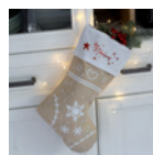
Nikolaussocke Seite 112