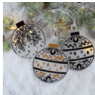
Baumschmuck »Acryl« Seite 16