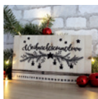
Weihnachtscountdown Seite 98