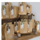
Kalender »Papiertüten« Seite 104