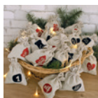
Kalender »Jutesäckchen« Seite 102