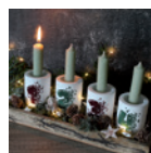
Adventskranz »Stabkerzenhalter« Seite 108