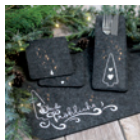
Platzset »Oh, du Fröhliche« Seite 86