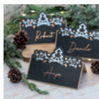
Tischkarten Seite 92