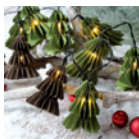
Lichterkette mit Tannenbäumen Seite 36