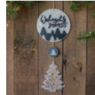
Girlande »Weihnachtszauber« Seite 22