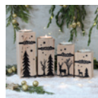
Adventskranz »Teelichthalter« Seite 110