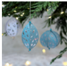
Baumschmuck »Papier« Seite 18