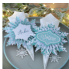
Serviettenring »Schneeflocke« Seite 88