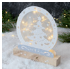
Mini-Lichterbogen »Schneekugel« Seite 32