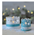
Teelichthülle »Sternenzauber« Seite 44