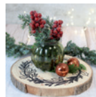
Untersetzer »Ilexkranz« Seite 94