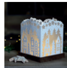
Lichthülle »Häuser« Seite 38