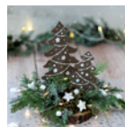
Stecktannen Seite 96