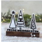
Klötzchendeko »Tannen« Seite 14