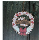
Türkranz Seite 26