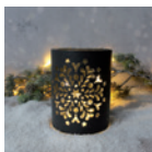
Schneeflockenglas Seite 28