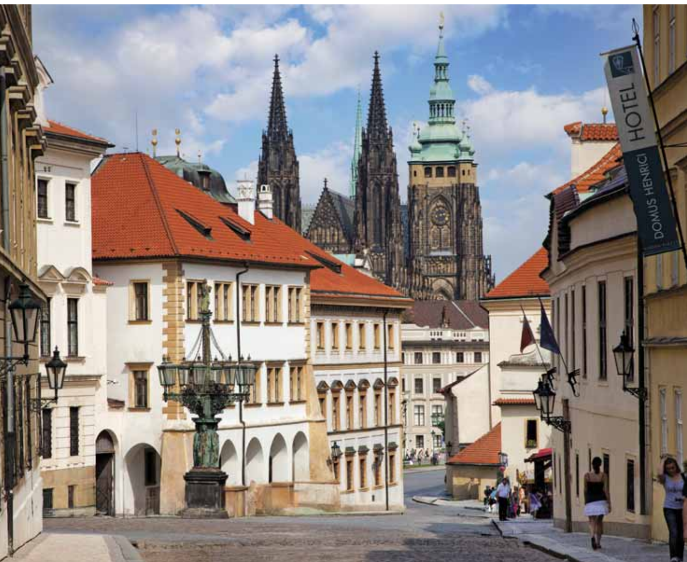
La rue Loreto, dans le quartier du Château.