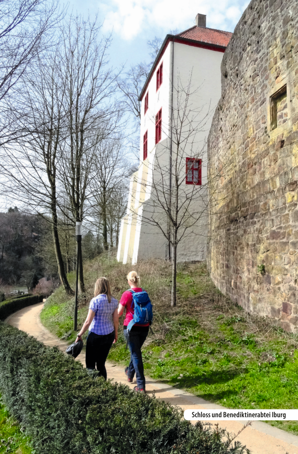
Schloss und Benediktinerabtei Iburg