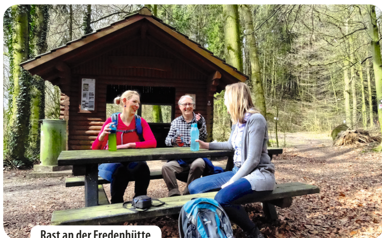
Rast an der Fredenhütte

Nach der Stärkung folgen wir weiter dem Hermannsweg . Er verläuft nun an der Südflanke des Berges und