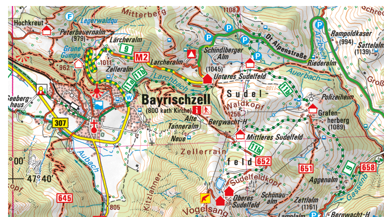
Ausschnitt aus der UK50-53 Mangfallgebirge

Kulturbegeisterte machen einen Ausflug in die schicke Altstadt von Rosenheim. Für Familien bietet sich das „Markus Wasmeier Freilichtmuseum Schliersee“ an. Das beliebte Dorfmuseum begeistert Jung und Alt! Actionreicher wird's beim Wasserski- und Wakeboarden in Kiefersfelden und im WakeBeach Bad Aibling. Entspannung findet man im Jod-Schwefelbad in Bad Wiessee sowie in der Therme Bad Aibling