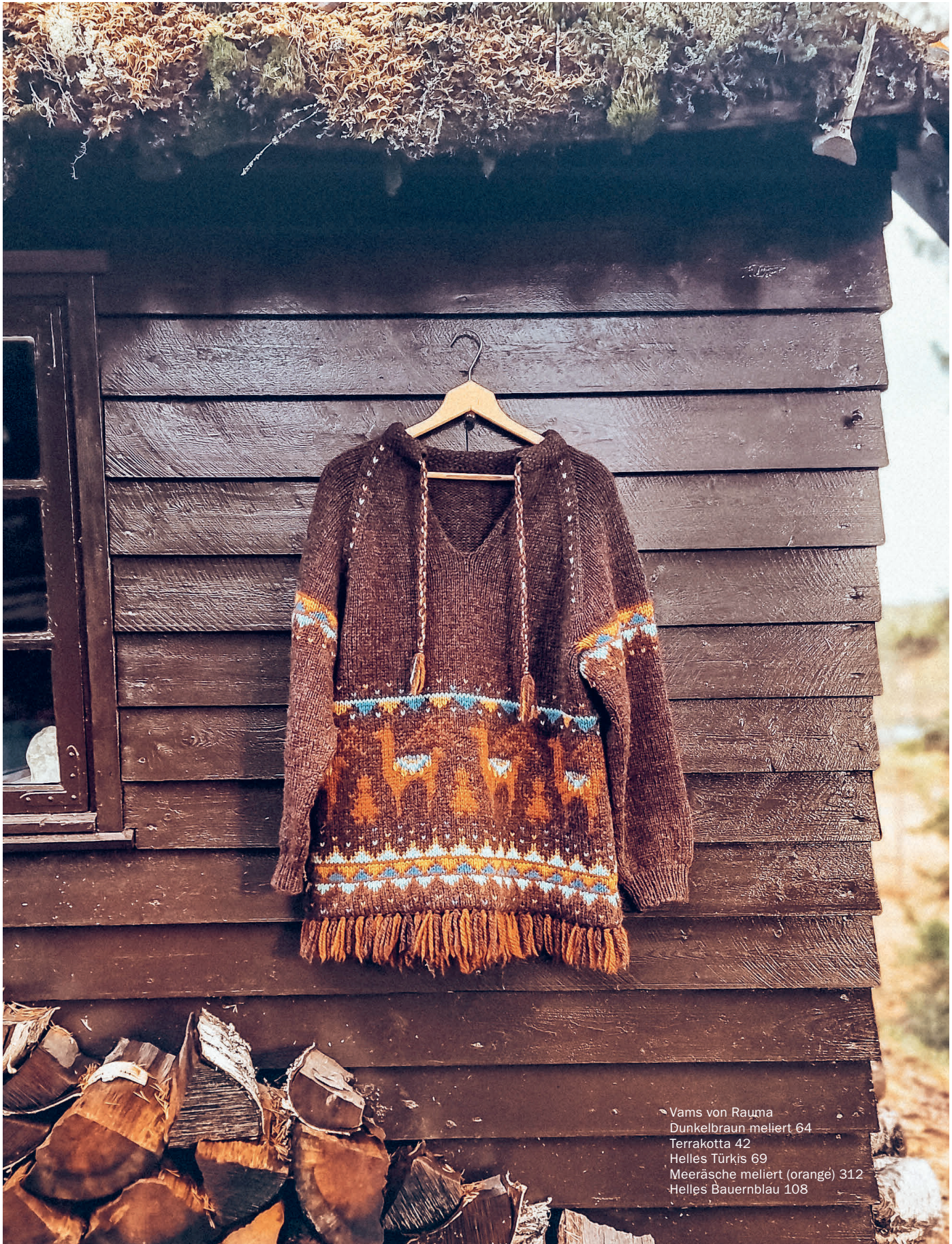
◀ Vams von Rayma Dunkelbraun meliert 64 Terrakotta 42 Helles Türkis 69 Meeräsche meliert (orange) 312 Helles Bauernblau 108