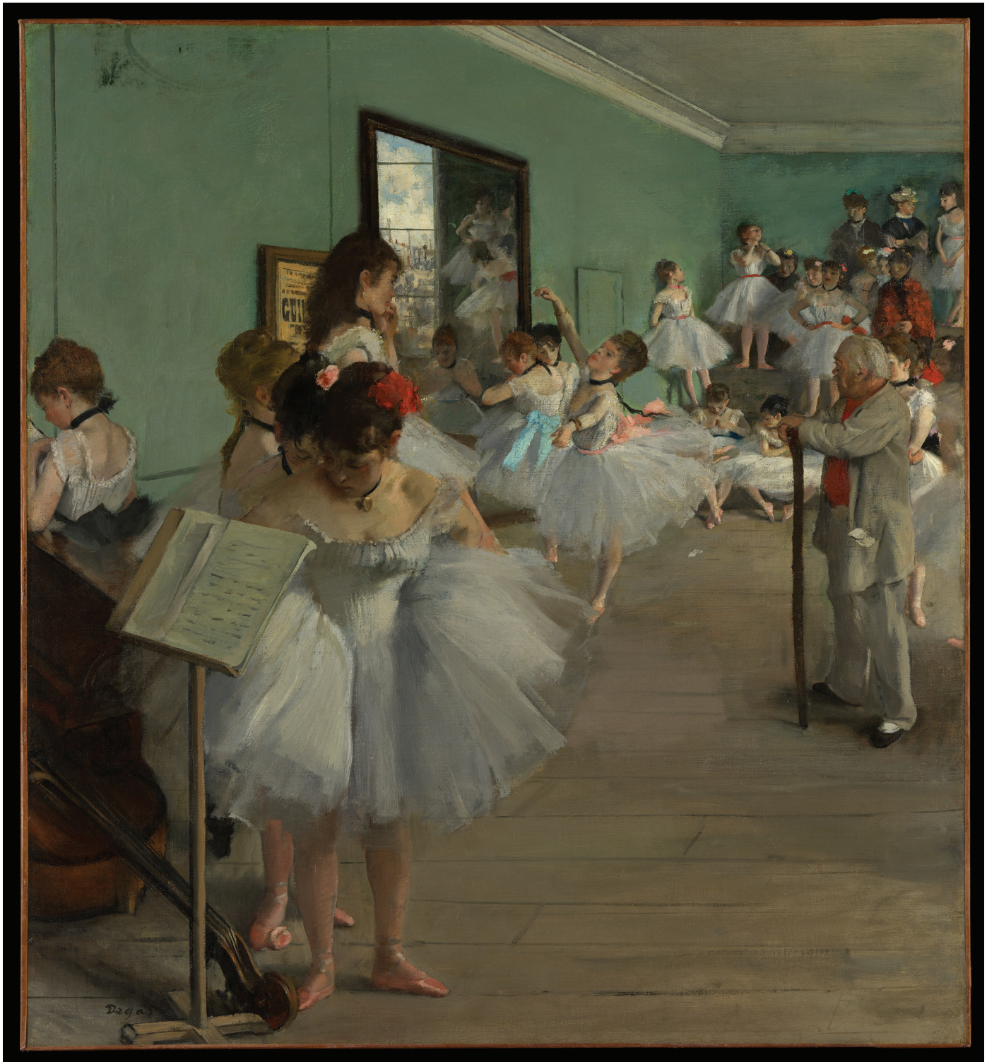
Edgar Degas (1834–1917) Die Tanzstunde (1874)