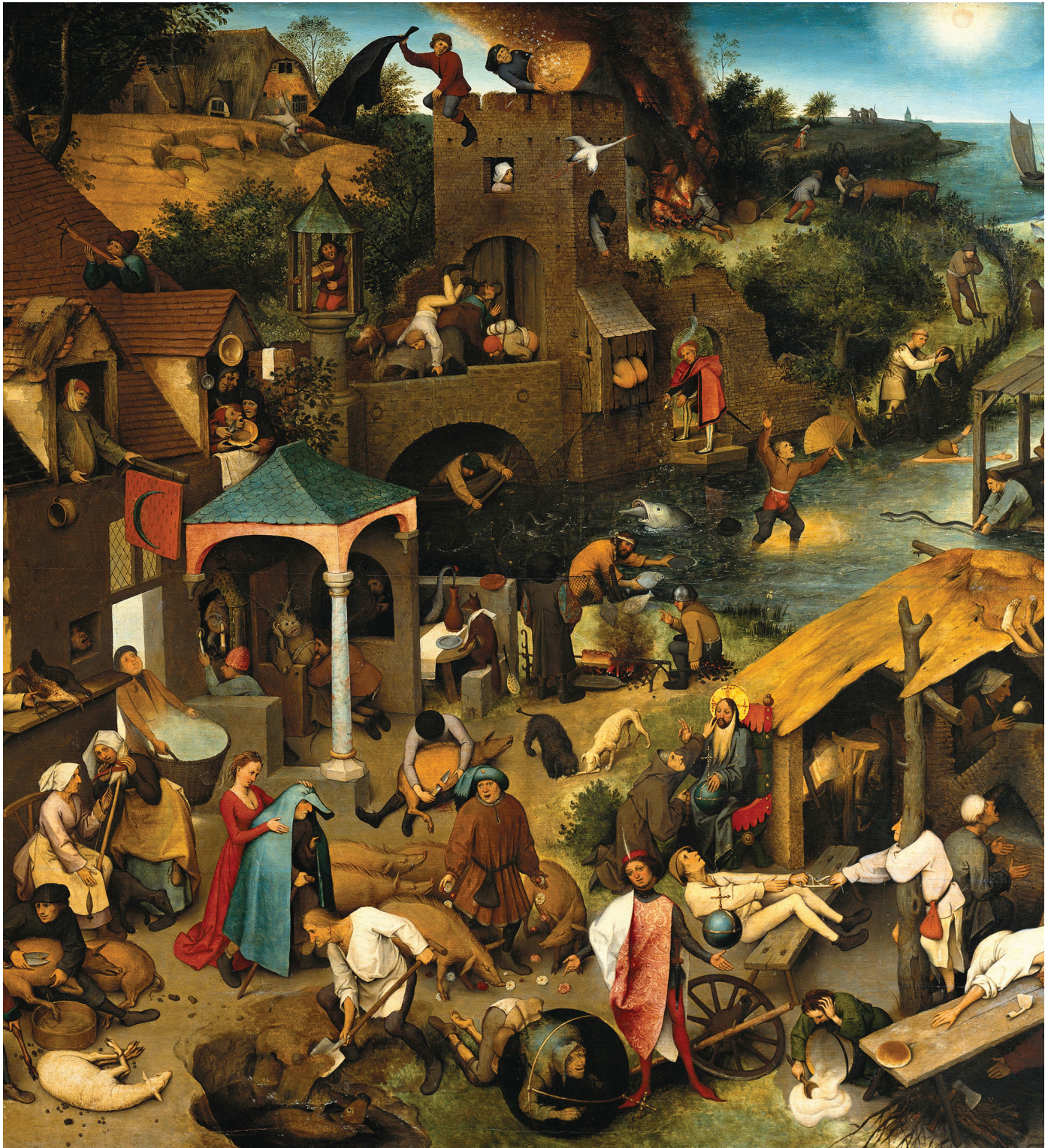
Pieter Bruegel der Ältere (um 1525/1530–1569) Die niederländischen Sprichwörter (1559)