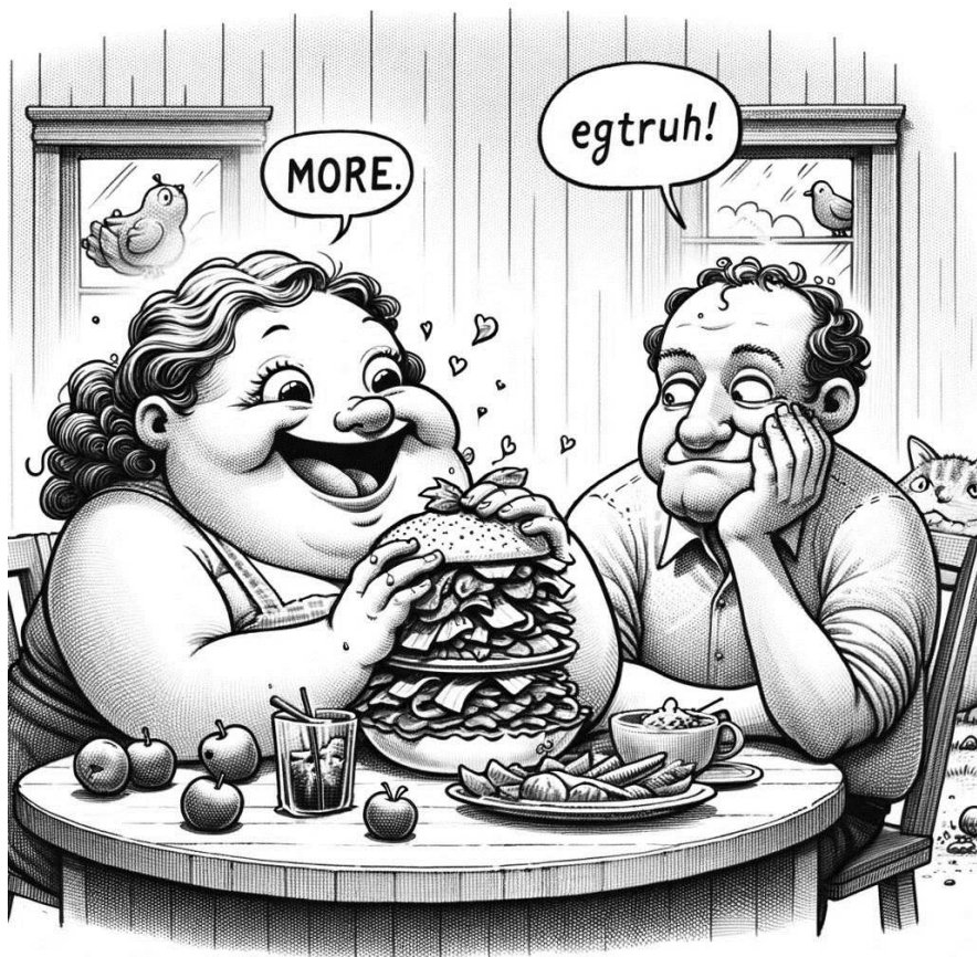
Dieses Bild wurde mit Hilfe von KI generiert und mit Hilfe von DALL-E 2 erstellt.