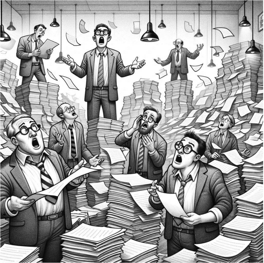
Dieses Bild wurde mit Hilfe von KI generiert und mit Hilfe von DALL-E 2 erstellt.