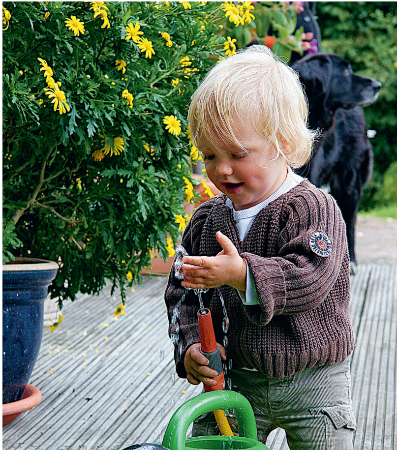
Mit allen Sinnen die Welt begreifen