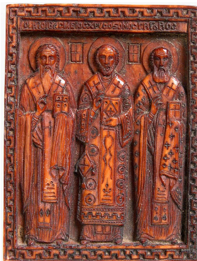
Padri della Chiesa [i3]