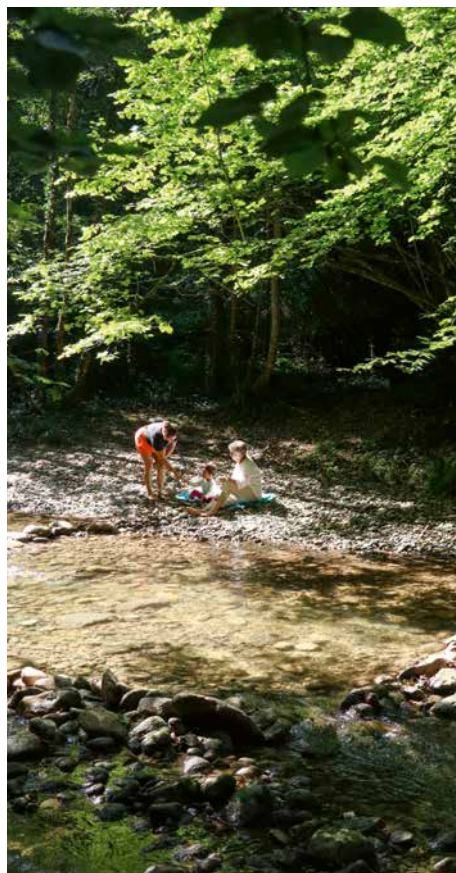
Le Veyron, au dessus de la Tine de Conflens

Le Veyron, rivière peu profonde, invite à y patauger; vous pouvez jouer et faire des grillades sur de petits bancs de gravier ombragés. C'est un lieu agréable pour les familles avec des jeunes enfants. À 10 minutes de marche de là, le Veyron et la Venoge se rejoignent dans la grande cuvette luxuriante de la Tine de Conflens (voir photo double page suivante), ensoleillement de 13 h à 15 h environ), du patois vaudois signifiant «gorge des confluent». L'accès aux bords de la cuvette est interdit, car la commune de la Sarraz craint les accidents dus à des chutes de pierres ou des crues. À la conclusion des recherches consacrées à la rédaction du présent ouvrage, aucun accident de la sorte n'était néanmoins connu. Les baigneurs et baigneuses sont en réalité nombreux à la Tine de Conflens; bien des locaux ignorent l'interdiction.