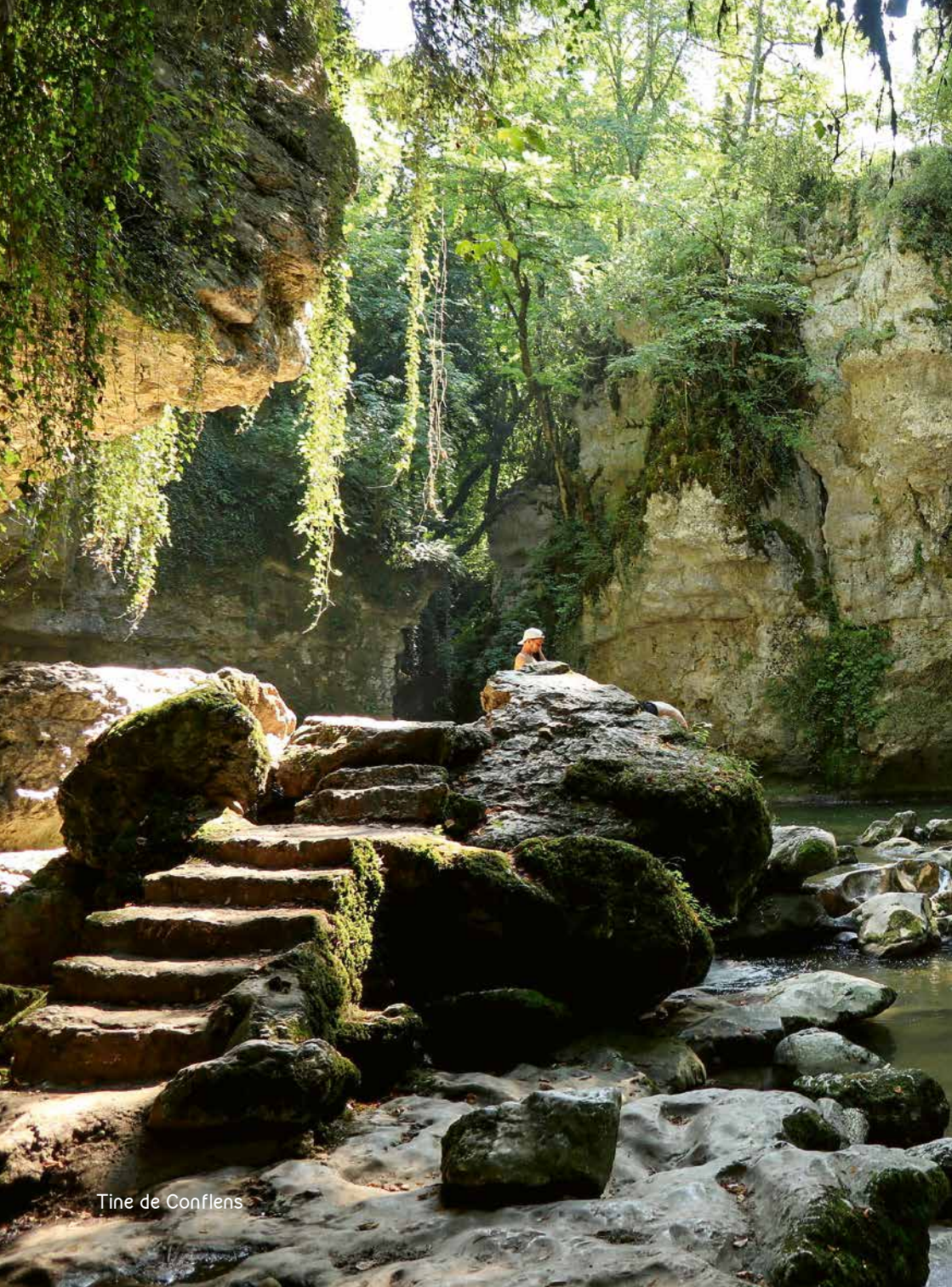
Tine de Conflens