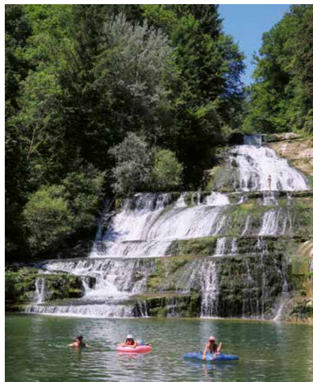
Saut du Day