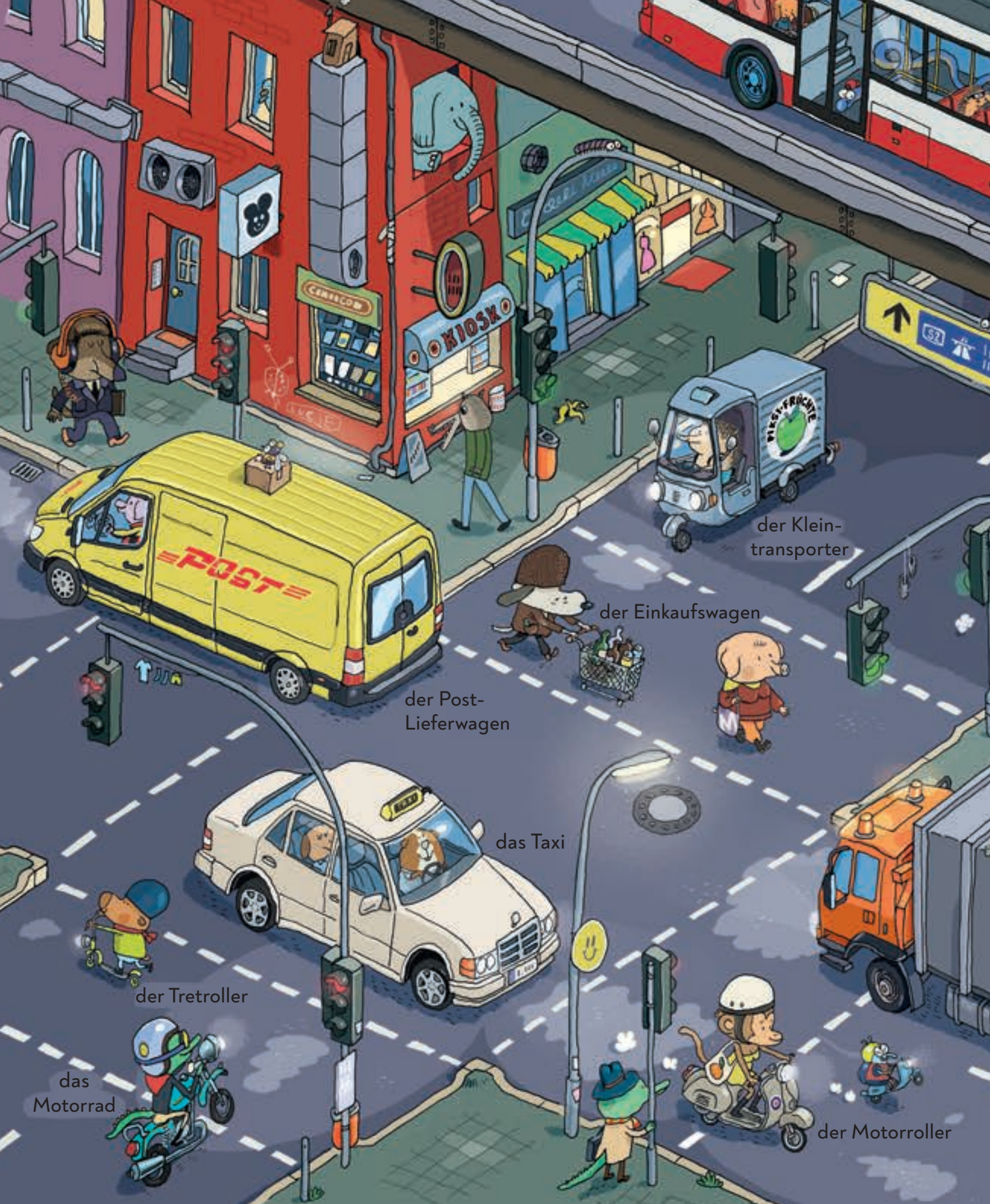
der Klein- transporter