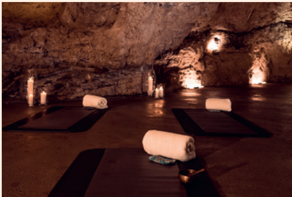
Oben: Gipfelblick im Day Spa und Health Retreat Bleib-Berg Unten: Tief einatmen im Heilklimastollen Friedrich