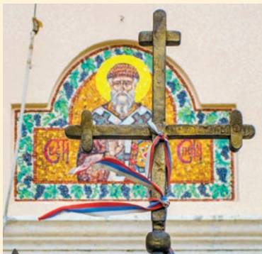
Ebenfalls serbisch orthodox: die Kirche in Đenović

Die vorerst letzte Eskalation des Streits stellte die Amtseinführung des neuen serbisch-orthodoxen Metropoliten Joanikije im Herbst 2021 dar, als dessen Gegner mit Straßenblockaden die Inauguration zu verhindern suchten – vergeblich.