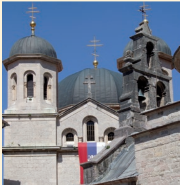
Die Kirche Sv. Nikola in Kotor

Die montenegroische Bevölkerung ist derweil gespalten. Wie viele der etwa 400 000 orthodoxen Montenegriner sich zu welcher der beiden Kirchen bekennen, ist unbestimmt. So gibt es derzeit zwei orthodoxe Kirchen in Montenegro mit der