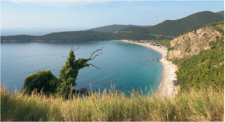
Am Strand in Ulcinj

Straße nicht als Einladung zum schnellen Fahren verstehen – gerade an diesen Stellen kontrolliert die Polizei sehr intensiv. Bald erreicht man die Grbalj-Ebene. Das ist ein Tal, das sich auf über 15 Kilometer erstreckt. In der Vergangenheit war es aufgrund seines fruchtbaren Bodens sehr häufig Grund für militärische Auseinandersetzungen zwischen den Herrschenden.