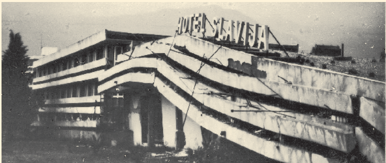
Zerstörung in Budva durch das verheerende Erdbeben

Der Tourismus, der wichtigste Wirtschaftszweig Montenegros, brach ein. Die Besucherzahlen gingen um 70 Prozent zurück, die Einnahmen schrumpften von vormals 80 Millionen Dollar auf 15 Millionen Dollar im Katastrophenjahr. Viele Fabrikgebäude waren zerstört, 30 000 Beschäftigte ohne Arbeitsplatz. Die Menschen wurden in Zelten untergebracht und mit dem Nötigsten versorgt. Zahlreiche Nachbeben sorgten für Angst und Schrecken. Als Konsequenz aus der Katastrophe verfügten die Behörden, dass alle neuen Gebäude erdbebensicher gebaut werden müssen. Das ist dringend geboten ist, denn die Küste Montenegros befindet sich auf tektonisch schwierigem Gebiet – hier stoßen gleich mehrere Platten zusammen –, und Wissenschaftler haben errechnet, dass Montenegro etwa alle 70 Jahre von einem größeren Erdbeben heimgesucht wird.