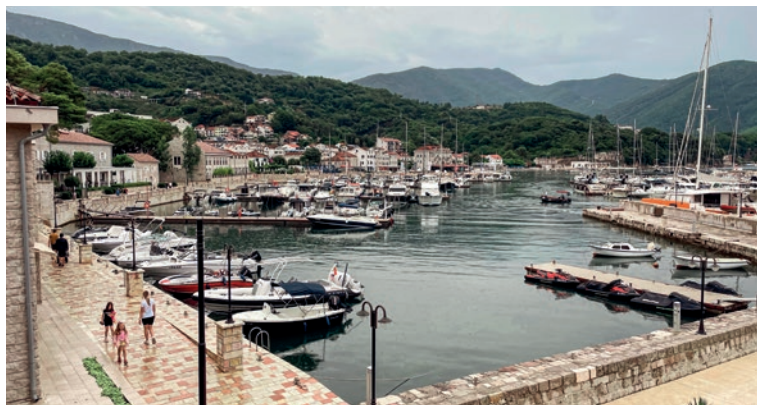
Der Bootshafen in Meljine

Wellness & Spa Hotel ACD , Ulica Narodnog fronta 91, Tel. +382/31/200506; DZ ab 60 Euro. Modernes Vier-Sterne-Haus, Pool und Wellnesscenter. Hotel-eigener Parkplatz. Bis zum Strand geht man etwa 150 Meter. http://acd.co.me