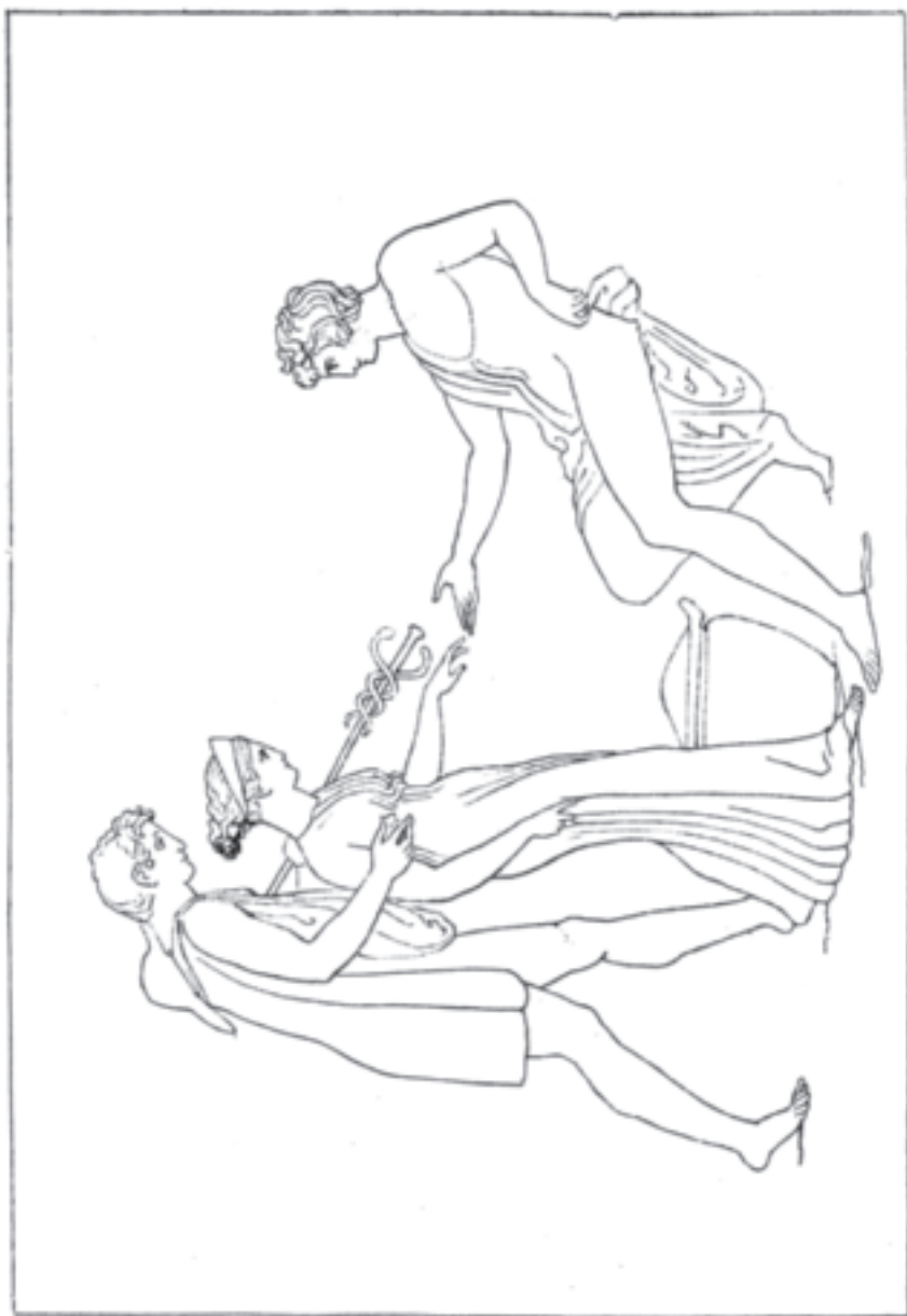
Epimetheus empfängt Pandora aus des Hermes Händen