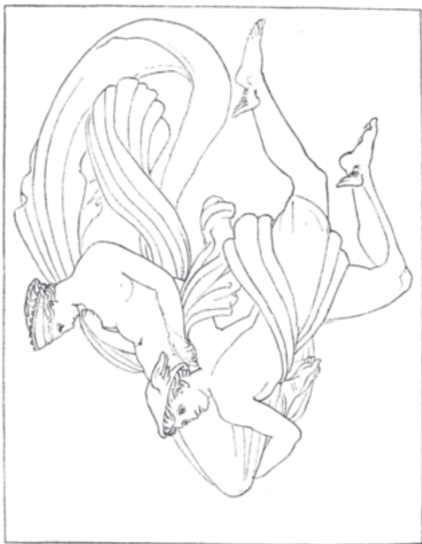
Pandora wird von Hermes zur Erde gebracht