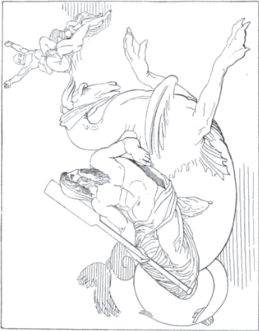
Akeanus naht dem Prometheus, der von den Okeaniden umgeben ist