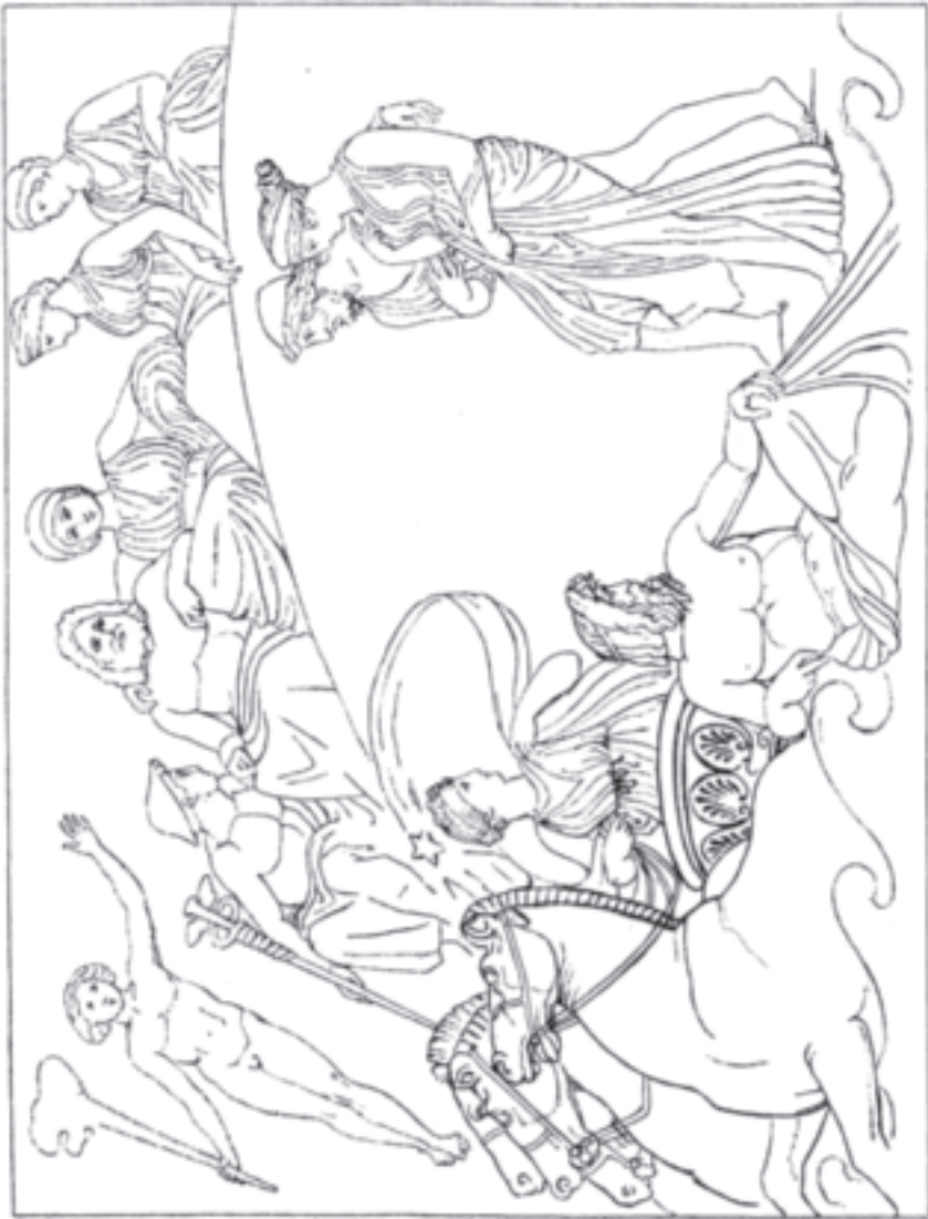
Pandora wird von den Göttern und Menschen bewundert