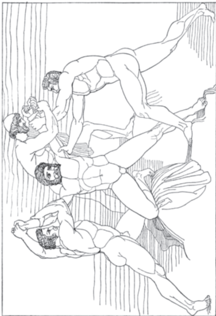
Hephästos mit Kratos und Bia fesseln Prometheus