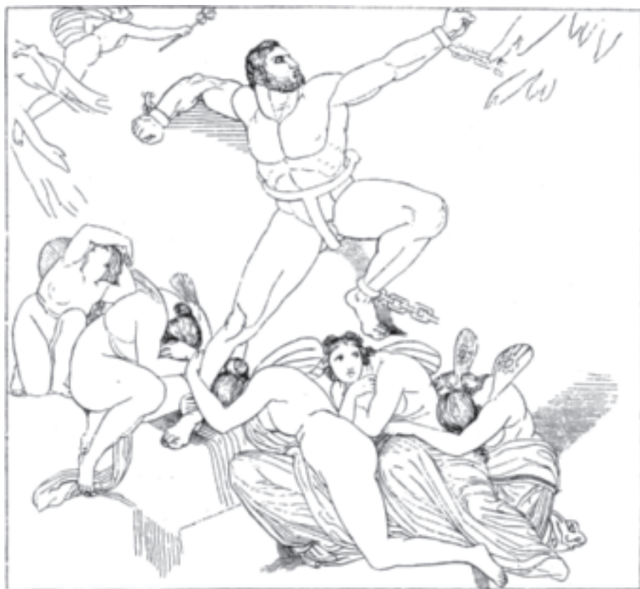
Prometheus von Zeus in den Abgrund gestoßen