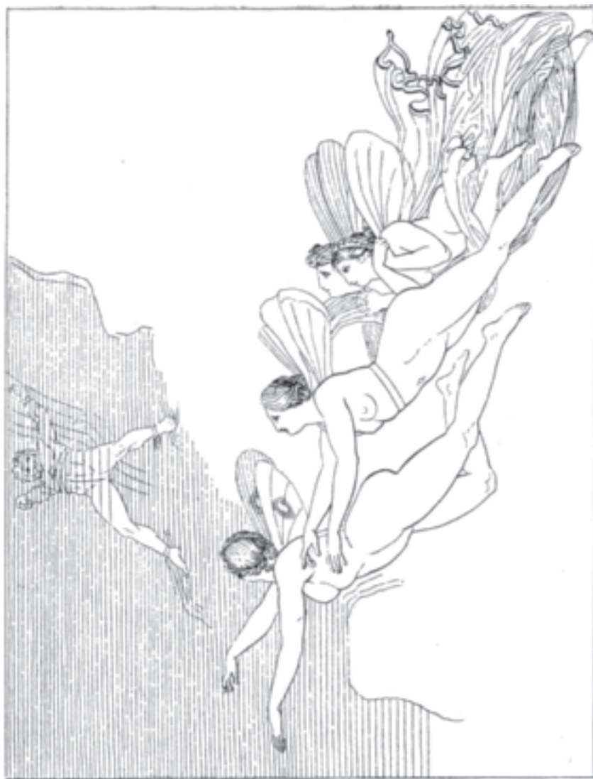
Die Okeaniden schwimmen zum gefesselten Prometheus