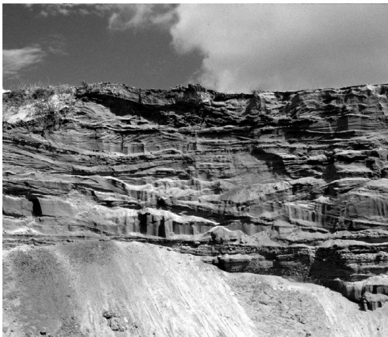
Blick auf die Mosbach-Sande bei Wiesbaden im Jahre 2008.