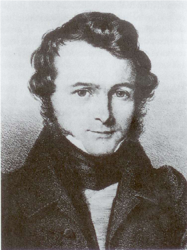
Frankfurter Wirbeltierpaläontologe Hermann von Meyer (1801–1869).