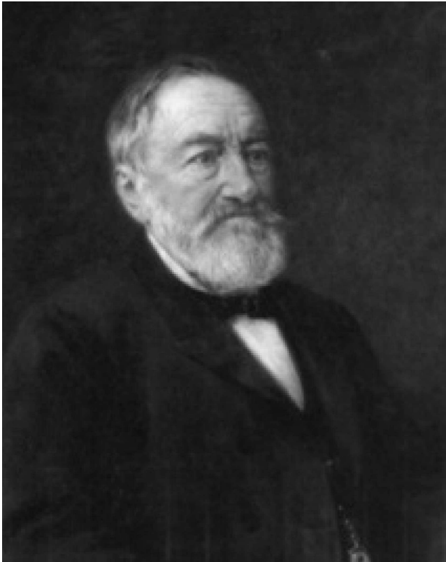
Unternehmer Wilhelm Gustav Dyckerhoff (1805–1894), Gründer des ersten deutschen Zementwerks in Amöneburg bei Biebrich.