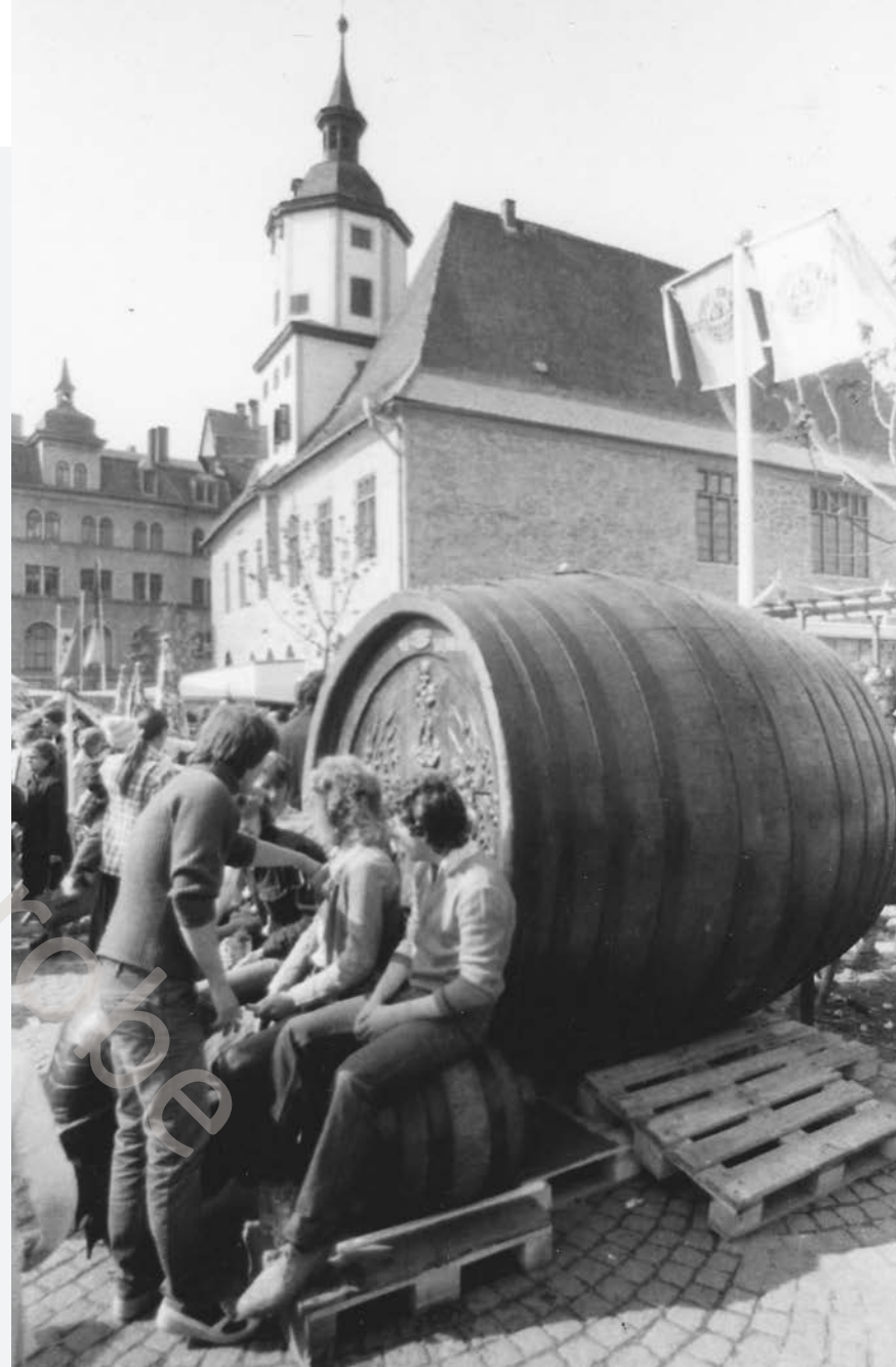
Rast am Fass 1982. Elf Jahre später marschierte das Pferdegespann der Brauerei Jena letztmalig zum Markt. Das Aus einer langen Tradition!