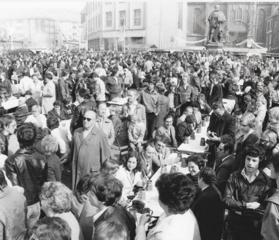
Der Jenaer Brauermarkt als beliebtes Volksfest hatte eine große Anziehungskraft. Im Hintergrund zu sehen ist die Marktnordseite, wo eine Baulücke klaffte, die erst 1992 mit einem Wohn- und Geschäftshaus geschlossen wurde.