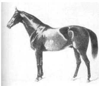
Garanhão reprodutor [i2]