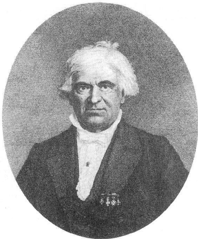
Archäologe Christian Jürgensen Thomsen (1788–1865). Bild: Porträt vor 1865