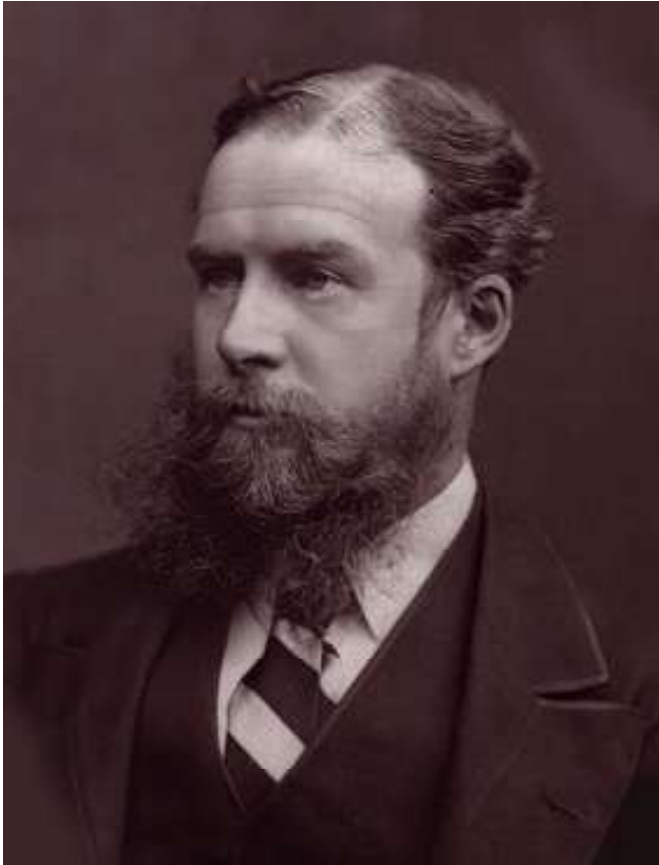
Prähistoriker John Lubbock (1834–1913). Foto: zwischen 1876 und 1881 entstandenes Porträt