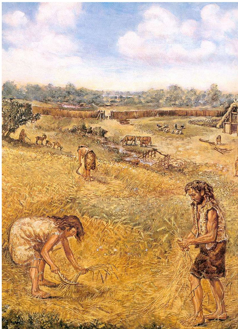
Frühe Ackerbauern in der Jungsteinzeit vor etwa 7.500 Jahren. Bild: Gemälde von Fritz Wendler (1941—1995) für das Buch „Deutschland in der Steinzeit“ (1991) von Ernst Probst