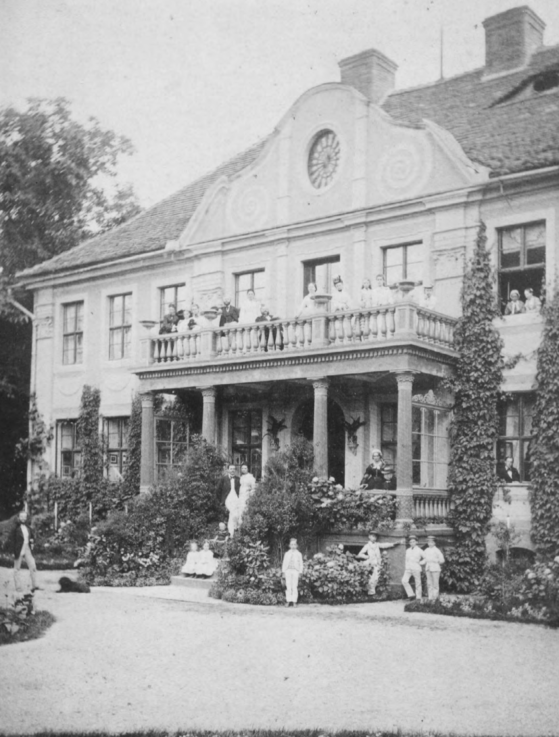
Familientreffen im Haus Förster in Grünberg ca. 1870