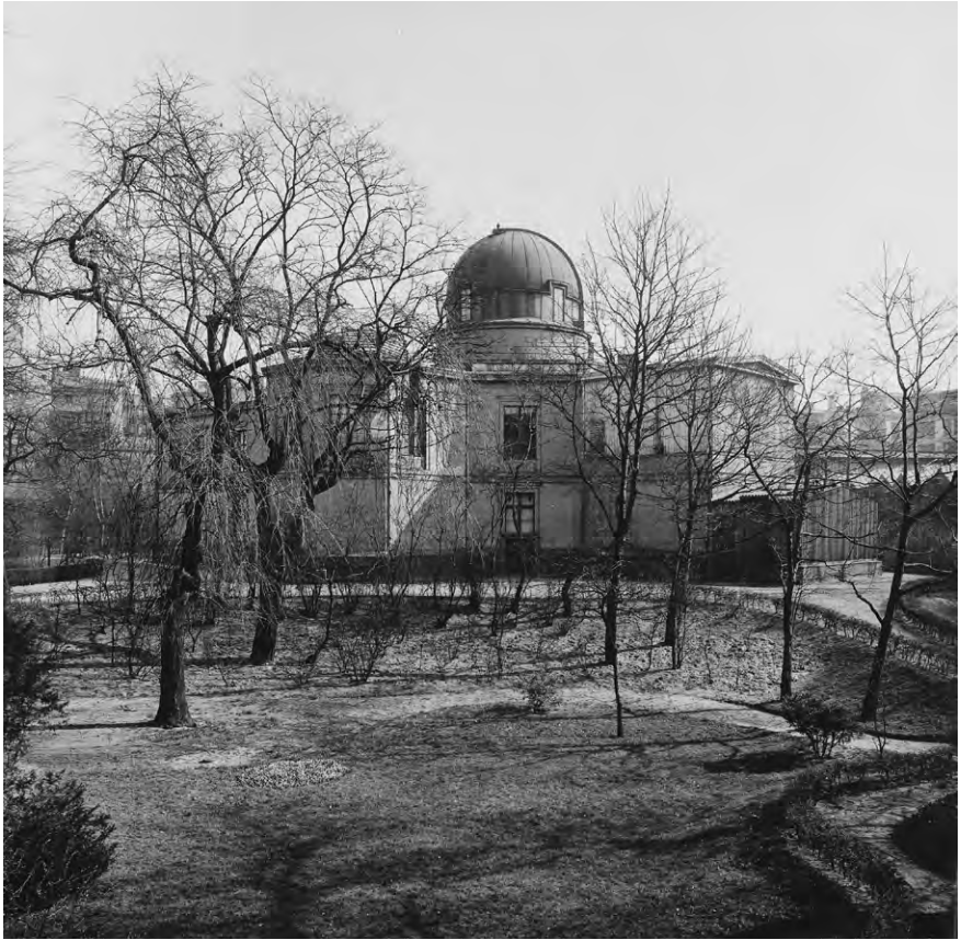
Die Sternwarte am Enckeplatz 1910

Die Kinder von Prof. Dr. Wilhelm Foerster wachsen auf dem Gelände der Sternwarte der Akademie der Wissenschaften in beinahe ländlicher Abgeschlossenheit auf. 3 Das Gelände befindet sich in einem Baublock der barocken Friedrichstadt zwischen Friedrichstraße, Besselstraße und Lindenstraße und ist von Häusern in Zeilenbauweise umschlossen. Es gibt zwei Zugänge. Der Haupteingang führt von der Lindenstraße im Osten schlauchartig durch eine Baulücke. Vor der Sternwarte weitet sich das Grundstück zu einem Rasenplatz, über dem sich, malerisch schräg stehend, die Schaufassade der Sternwarte erhebt. Von der Charlottenstraße führt ein Nebeneingang durch den Park zur Sternwarte.