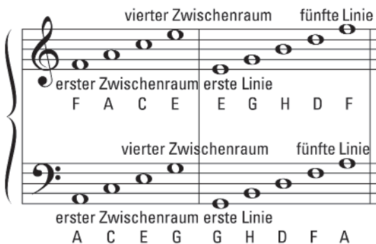
Abbildung 1.1: Töne im Notensystem erkennen