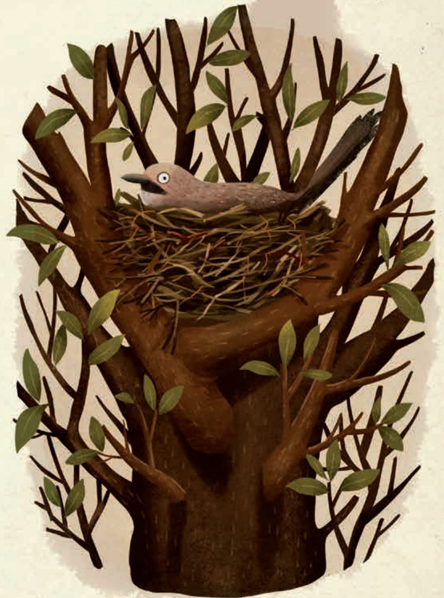
Tierbaue über der Erde