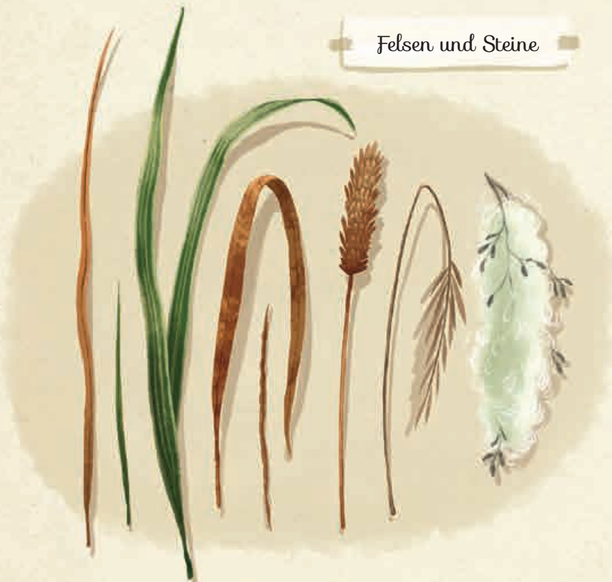
Grashalme, Pflanzenfasern und Samenwolle