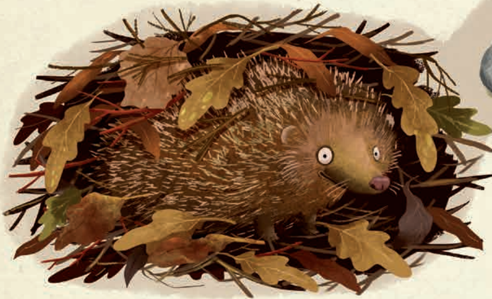
Tierbaue auf der Erde

Die Symbole auf den Steinen findest du auch auf den folgenden Seiten. Sie zeigen dir, um welche Art Behausung es gerade geht: