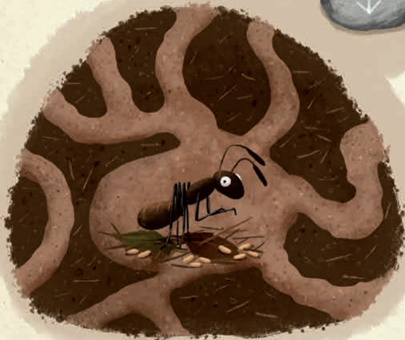
Tierbaue unter der Erde