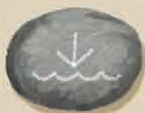
Häuser auf dem Wasser