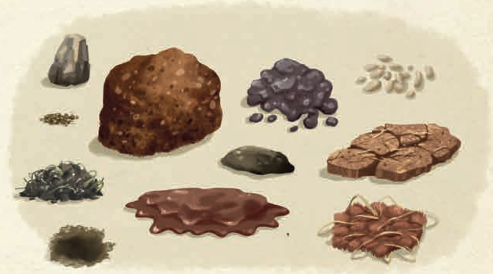
Schlamm und Lehm