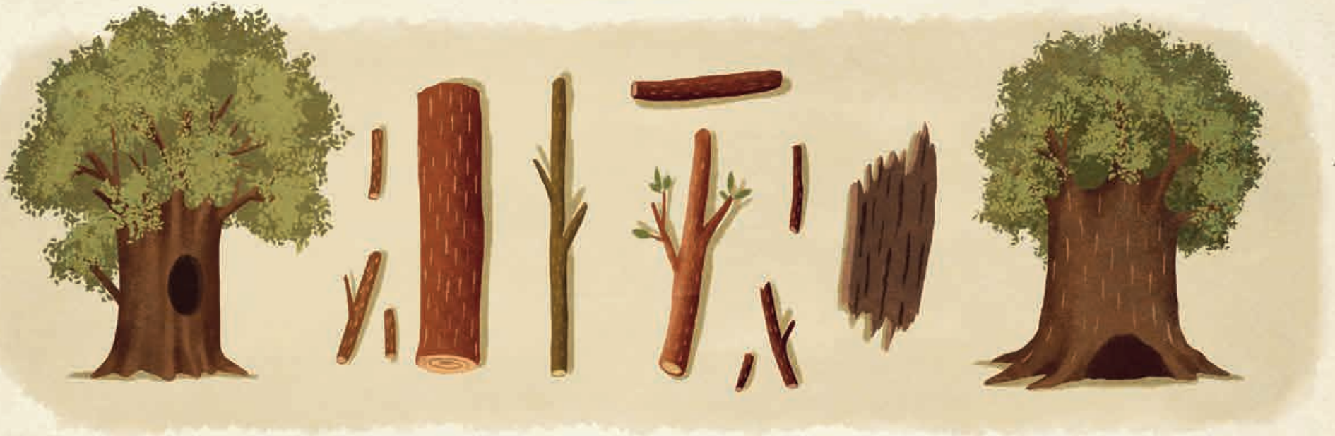
Bäume und Holz