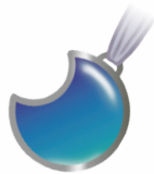
Illustration: Birgit Gaude