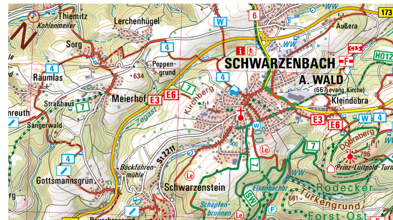
Ausschnitt aus UK50-4 Naturpark Frankenwald

Der Frankenwald bietet vielfältige Entdeckungsmöglichkeiten abseits des Massentourismus im Herzen Deutschlands. Familien verbringen einen schönen Tag in der Bergbau-Erlebniswelt Kupferberg oder im Tiergarten Sonneberg. Unvergessliche Erinnerungen sammelt man auf einer Floßfahrt auf der wilden Rodach in Wallenfels. Badespaß bieten das Erlebnisbad Crana Mare in Kronach oder die Thermo Bad Steben.