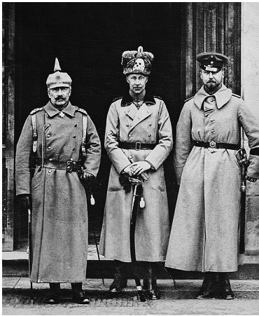
Kaiserbesuch im Hauptquartier des Kronprinzen im besetzten Stenay, Lothringen, 1915.

kung war verstrichen, die Option, als Kaiser abzudanken, jedoch König von Preußen zu bleiben, staatsrechtlich mehr als fragwürdig. 2 Ob auch der unter Offizieren diskutierte Plan eines selbst gesuchten Todes an den Kaiser herangetragen wurde, ist unsicher.