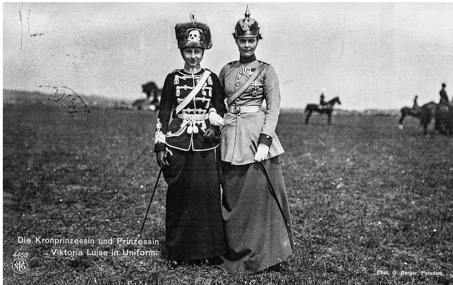
Kaisertochter Viktoria Luise und Kronprinzessin Cecilie in Kommandeursuniform, Postkarte von 1912.

Während die Familie zumindest symbolisch in ihrer Gesamtheit in den Krieg gezogen war, wird das neue, nach englischen Vorbildern gebaute Schloss für einen Thronfolger errichtet, der als Erbe seines Vaters im Fall eines gewonnenen Krieges wohl zu einer der mächtigsten Personen der Welt geworden wäre. Dies waren Programm und Selbstverständnis, in die Wilhelm von Preußen hineingeboren und für die er ausgebildet worden war.