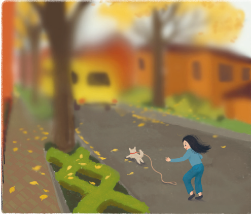
Wie Paul die Welt sieht.