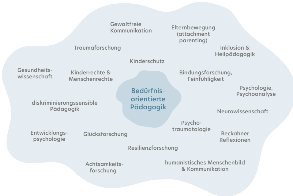
Abb. 1: Theoretische Einflüsse der BoP