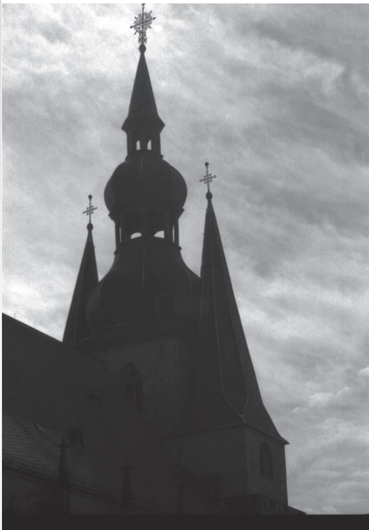
Kamera: Minolta X300 Objektiv: Tamron 35 -70 mm Filmmaterial: AGFAPHOTO 400 ASA

Rechts im Bild das Mittelschiff mit Blick auf die Orgel und ihre 57 Register.