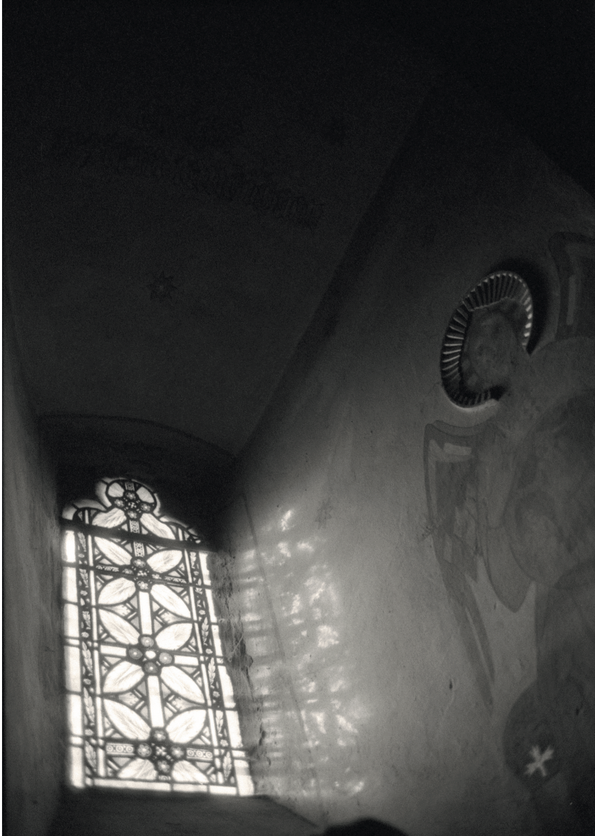
In der Turmkapelle