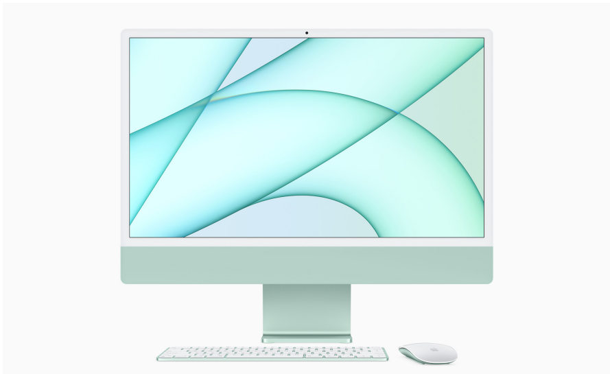
Ein Desktop-Computer aus dem Hause Apple: der iMac.