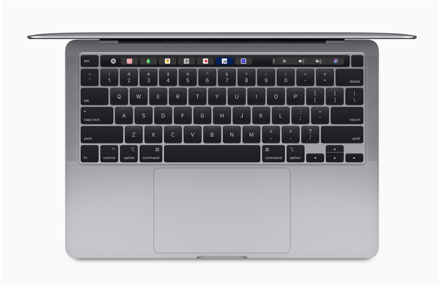
Diese Abbildung zeigt ein Notebook von Apple, ein sogenanntes MacBook.

lichen Formen an, diese werden als MacBook (sprich: [mäckbuck]) bezeichnet.